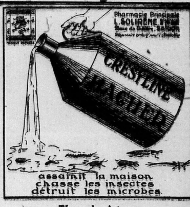
assainit la maison chasse les insectes détruit les microbes.