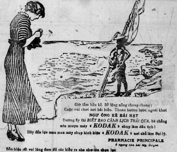
Bản-hiện rất vui lòng đem đủ các kiểu ra cho thuê-đem chụp lại

Thứ thuốc Peptonate de Fer Robin là một thứ thuốc tốt nhất cho những người có bệnh huyết suy, và thân thể yếu yếu, thứ thuốc ấy rất có ích cho huyết, lại có thể phòng được cả nguy hiểm của bệnh lao. Phần nhiều những thứ thuốc có chất sắt thường khó đi tiêu, uống vào sanh ra bị đại hiện, và trong mình thì hư-rối rồi, đến nay ông M rs ROBIN đem thuốc Peptonate de Fer hòa hiện với chất Pepton, mới chế thành ra đượ thứ thuốc để hòa, uống vào không ngưng trở ở dạ dày, và trong mình cũng không hư-rối gì cả. Thứ thuốc ấy dùng trong giọt một, không tốn lại để uống, thứ thuốc ấy cũng chế thành rượu chát và rượu Elixir, uống cũng ngon lắm. Những người mắc phải bệnh đau huyết, bệnh sưng, bệnh đau xương, bệnh lệ-thấp, bệnh giang-mai, bệnh cúm, bệnh đau phổi, bệnh sốt rét, bệnh nhức, hay sanh ra huyết yếu, thì cần phải dùng thứ thuốc Iodone Robin. Bà lâu nay, người ta vẫn biết rằng chất Iode là một thứ thuốc thanh huyết rất tốt phương lại hay sanh mệt nhọc trong mình. Thế nhưng thứ thuốc Iodone Robin này không phải vậy, vì là hóa hiệp hai chất Pepton và Iode mà chế ra. (Còn nữa) Có trữ tại nhà thuốc thương đặng L. SOLIRÈNE trước nhà hát tây, và tại các nhà thuốc tây đều có bán. Phải nói cái hiệu ROBIN, đặng chữ như sau khác.