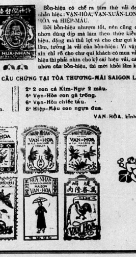
VAN-HOÀ, Kinh Thủ

Mã hiệu vải của Bồn-Hieu Đều có Cầu Chứng tại Tòa Thượng-Hải Saigon