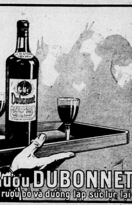
Rượu DUBONNET là rượu bổ và đường lập sức lực lại

Tôi quyết tâm thương với người bán, nên nay tôi