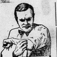
Đúng có quà gói như vậy có người thì lấy Pomme Cadam thơm, em ai biết liền