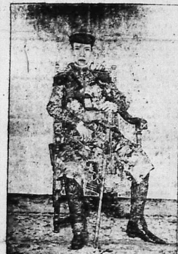
Ảnh chân dung của một nhân vật quan trọng.