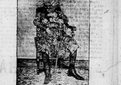
(Đây là tên đương Đốc Kinh Hoàng-thượng Khải-Định ngự chung-cử)