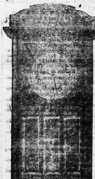
(Thân tình nguyện của chủ nhân kính chào)