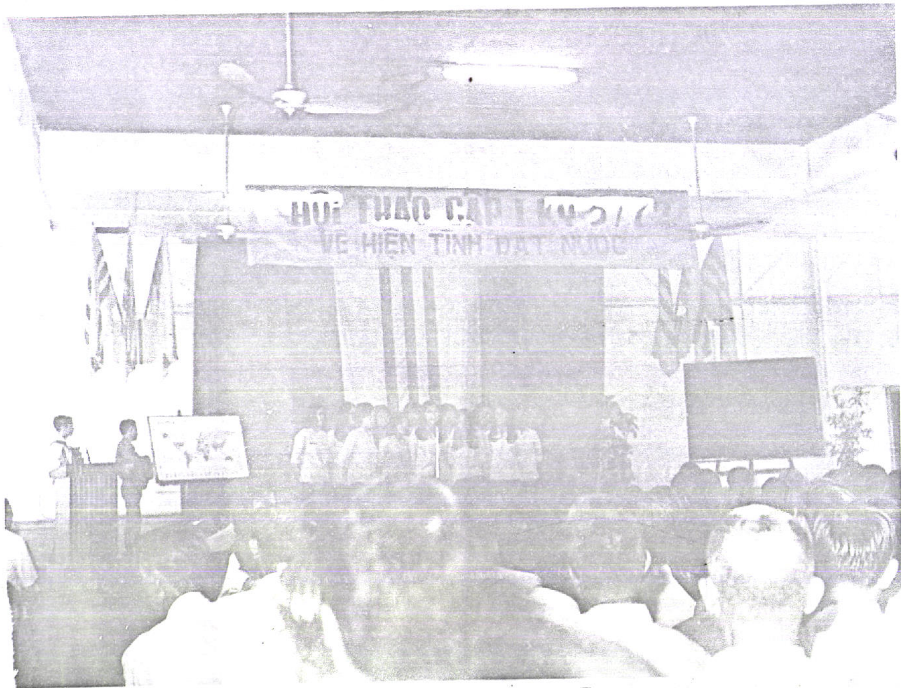
Một buổi sinh hoạt hội thảo học tập chính trị Thông-Lưu Đại Chúng tại Đô-Thành