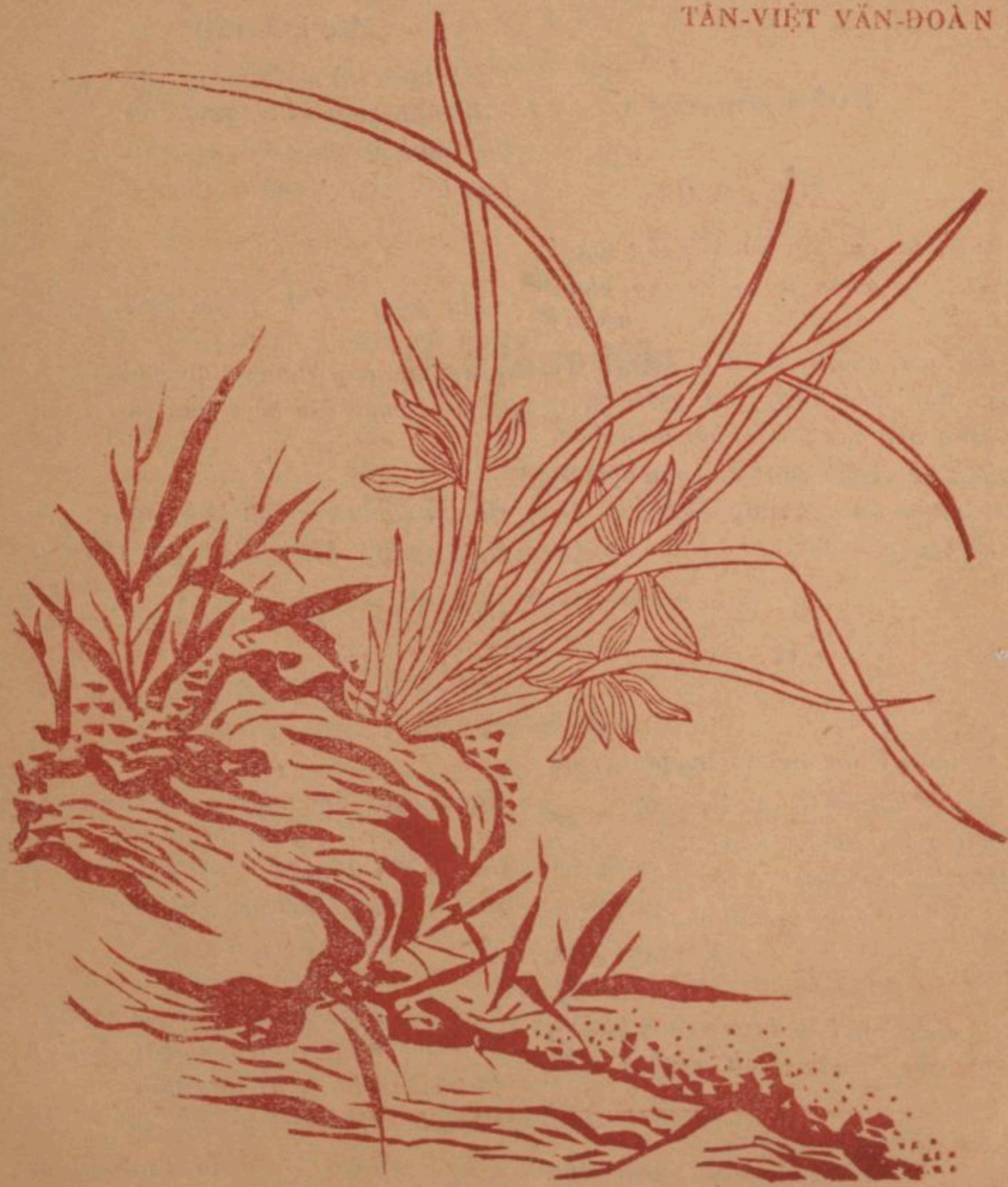
Đessin de Thuy - Hà