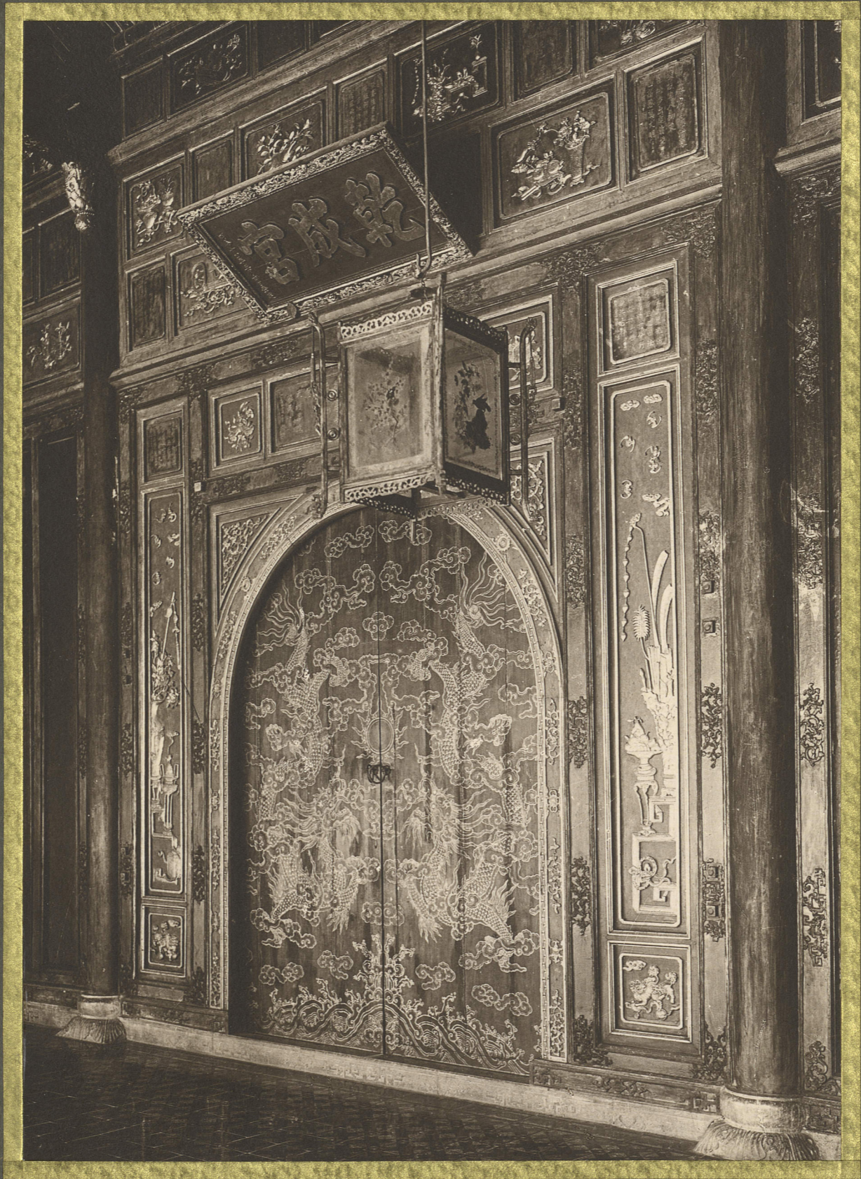
Hui . La Porte Dorée .

CENTRE DE DOCUMENTATION ET DE RECHERCHES SUR L'ASIE DU SUD-EST ET LE MONDE INDONESIEN BIBLIOTHEQUE