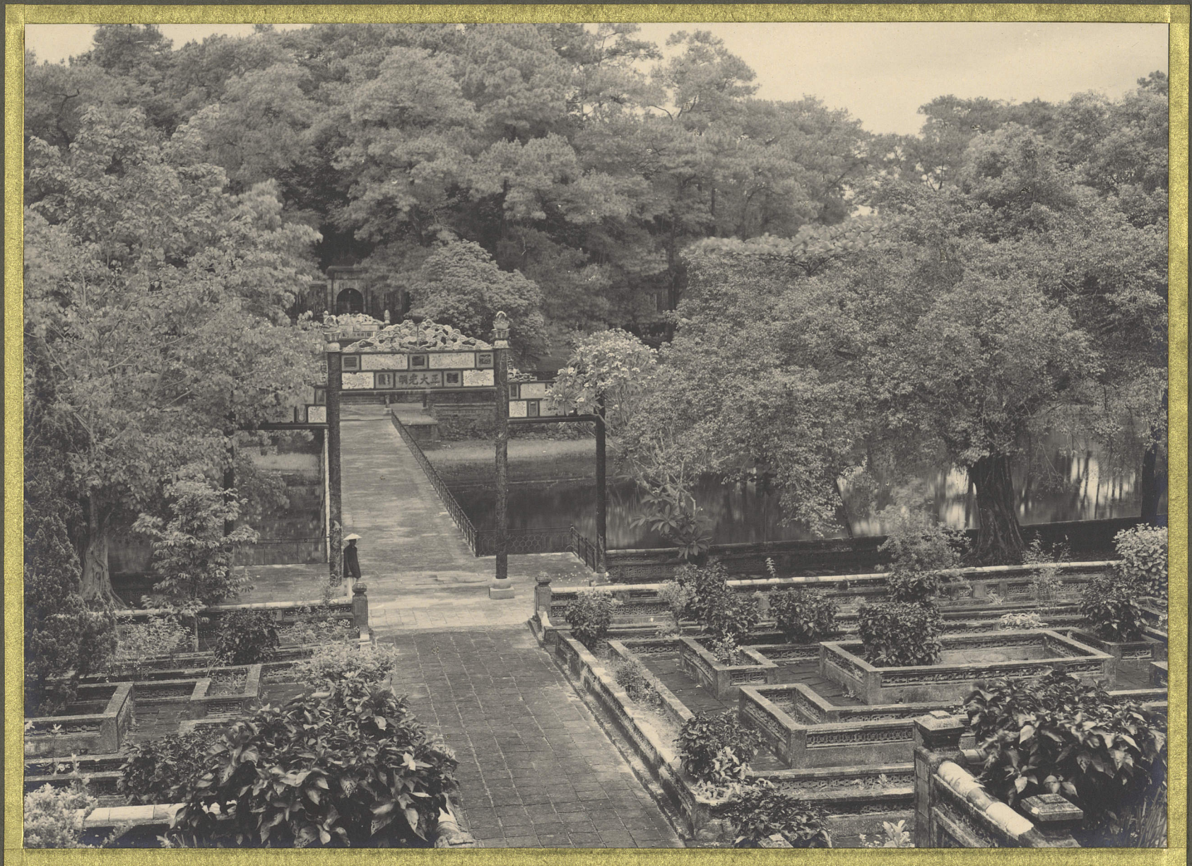
Tombeau de l'Empereur Minh Mang. Au fond: le tombeau.