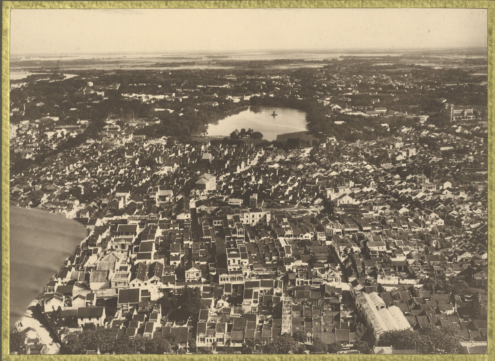
Hanoi. Vue générale.

CENTRE DE DOCUMENTATION ET DE RECHERCHES SUR L'ASIE DU SUD-EST ET LE MONDE INDONESIEN BIBLIOTHÈQUE