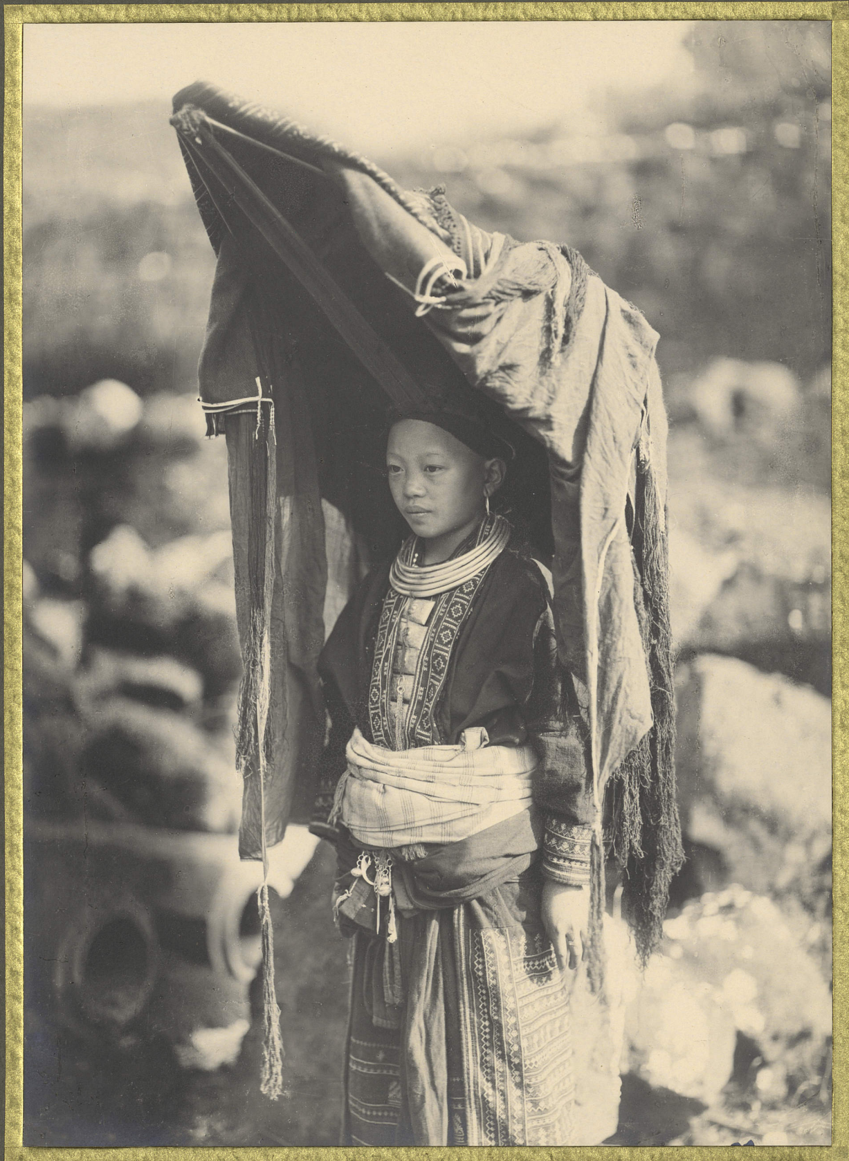
Lao-Hay. Femme Mên en costume de maridé.

CENTRE DE DOCUMENTATION ET DE RECHERCHES SUR L'ASIE DU SUD-EST ET LE MONDE INDONESIEN BIBLIOTHÈQUE