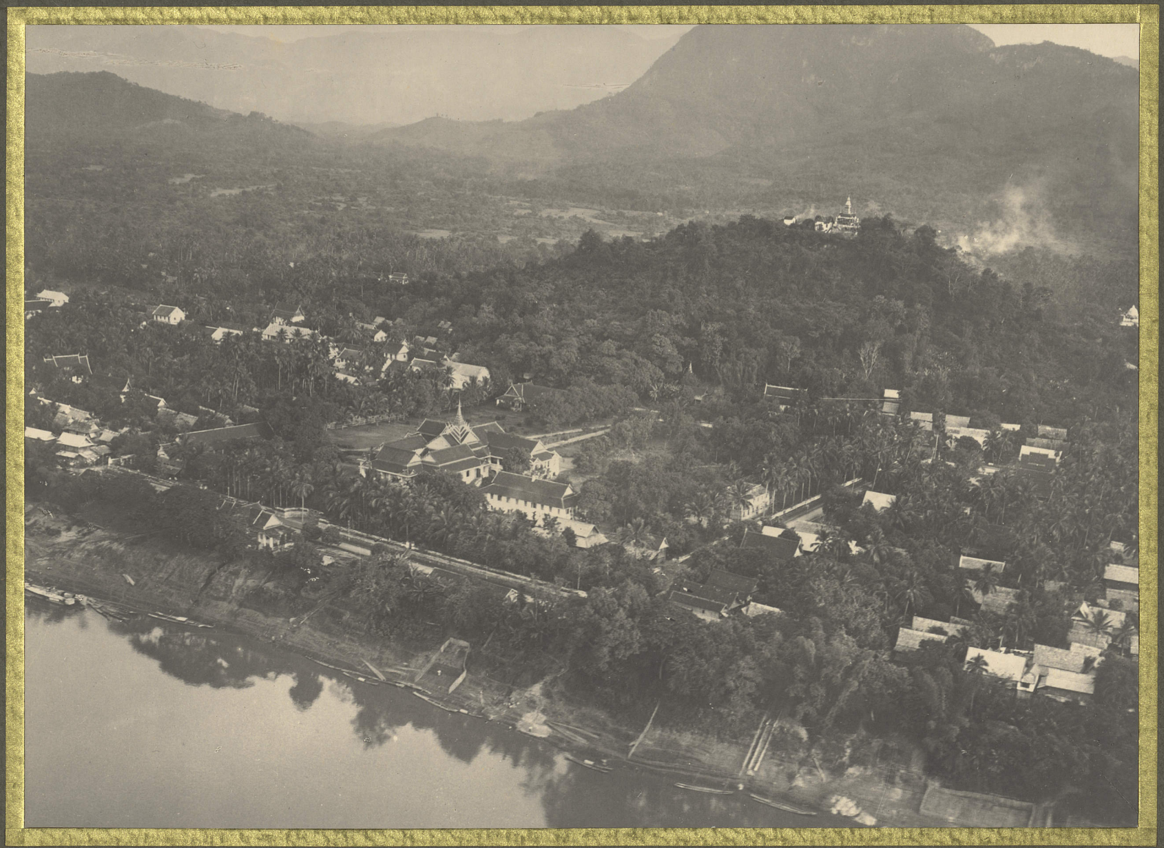
Luang-Prabang. Palais Impérial et pagode du Kou-Si.