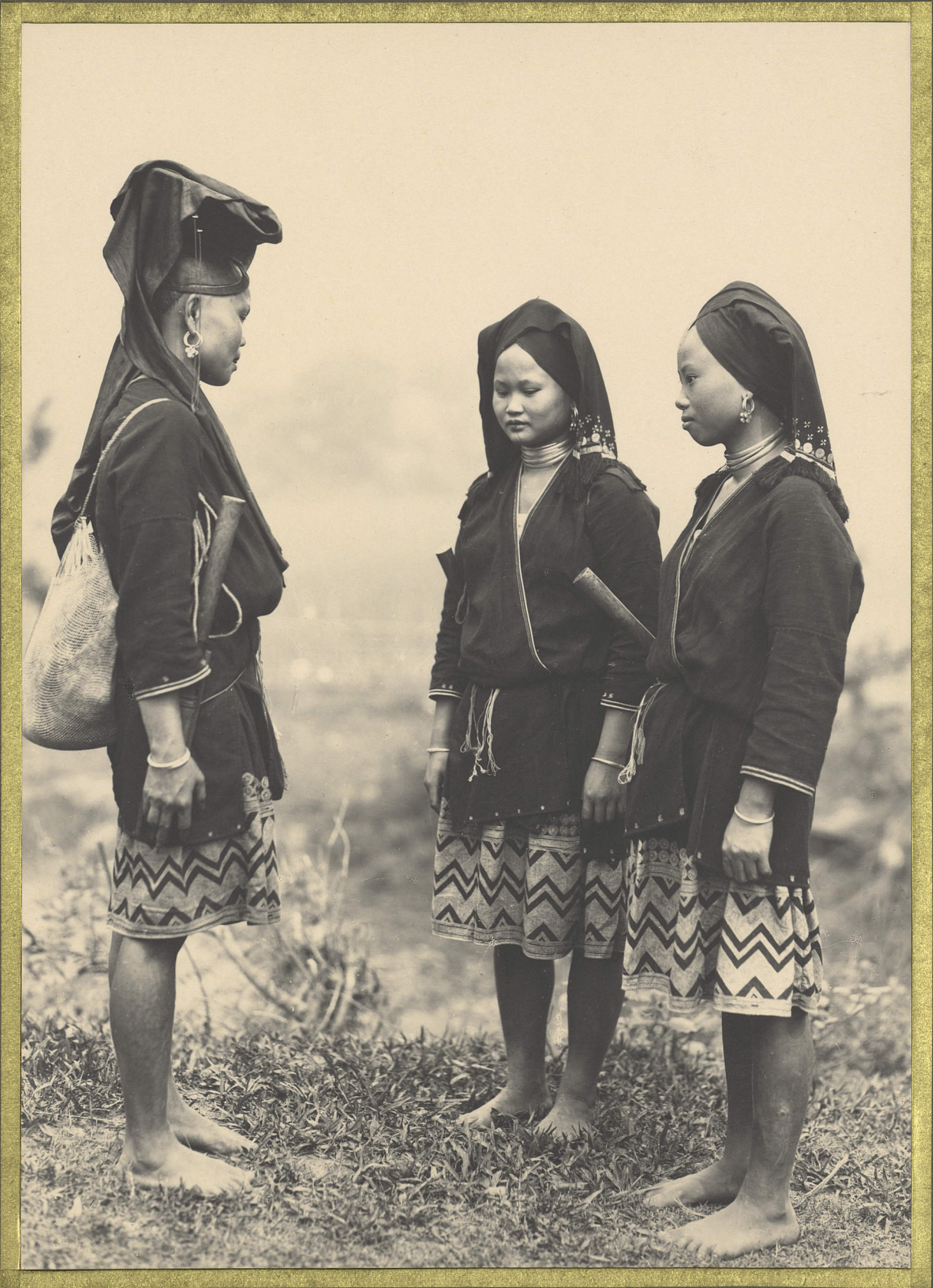
Sugut. Femmes Moin.

CENTRE DE DOCUMENTATION ET DE RECHERCHES SUR L'ASIE DU SUD-EST ET LE MONDE INDONESIEN BIBLIOTHEQUE