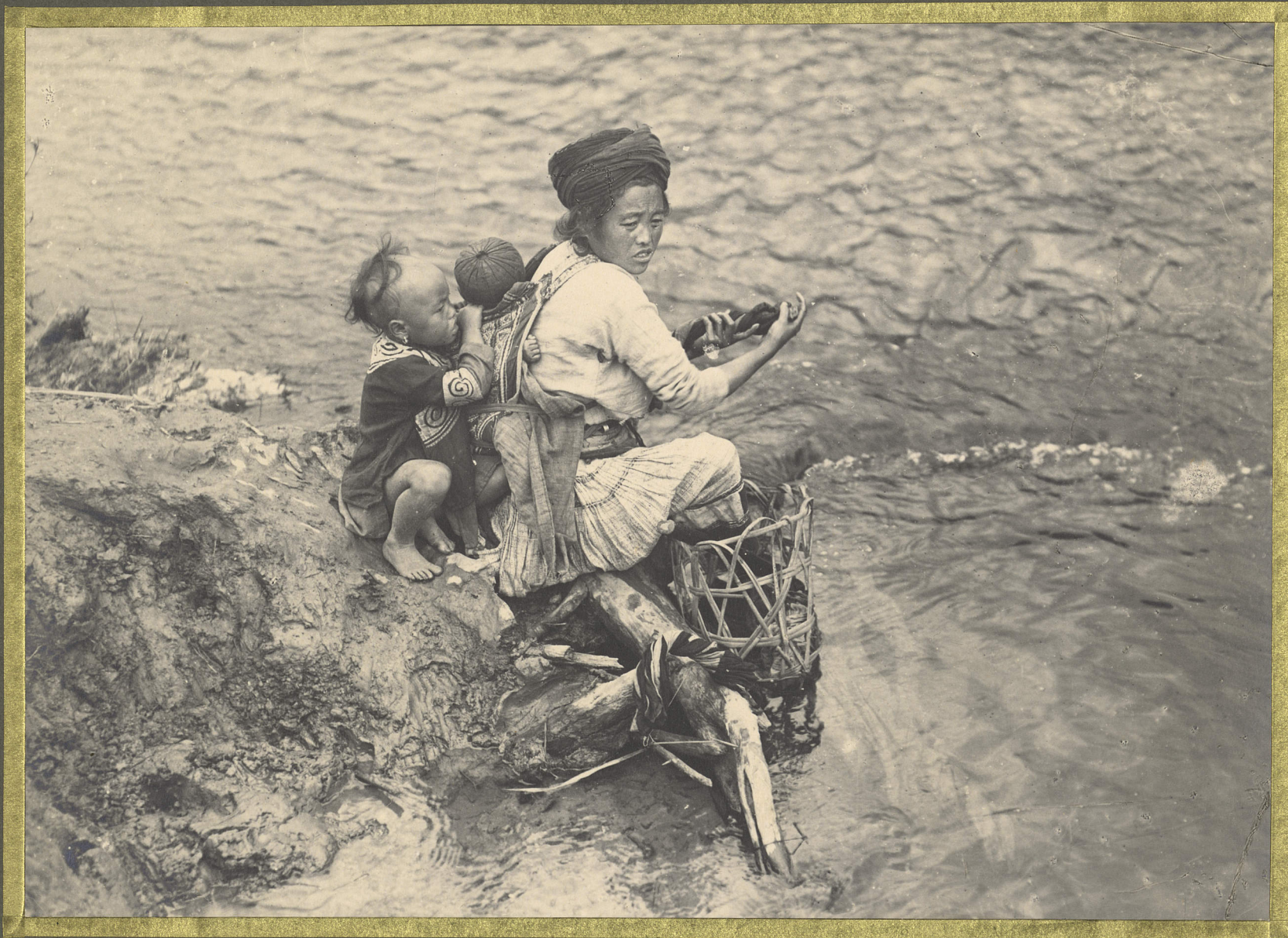
Talaha . Femme Miao .