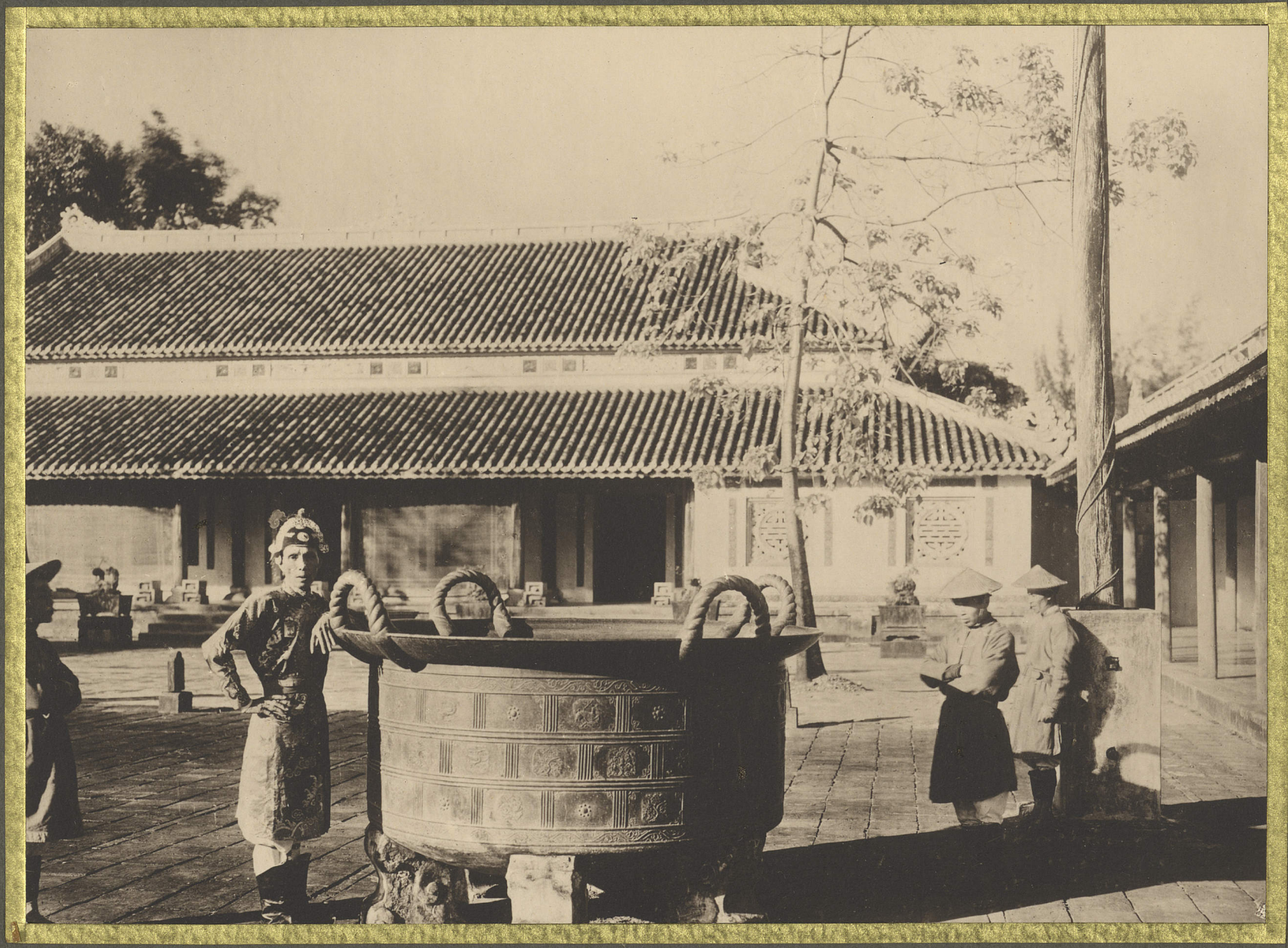
Hu. Une vasque en bronze.

CENTRE DE DOCUMENTATION ET DE RECHERCHES SUR L'ASIE DU SUD-EST ET LE MONDE INDONESIEN BIBLIOTHÈQUE