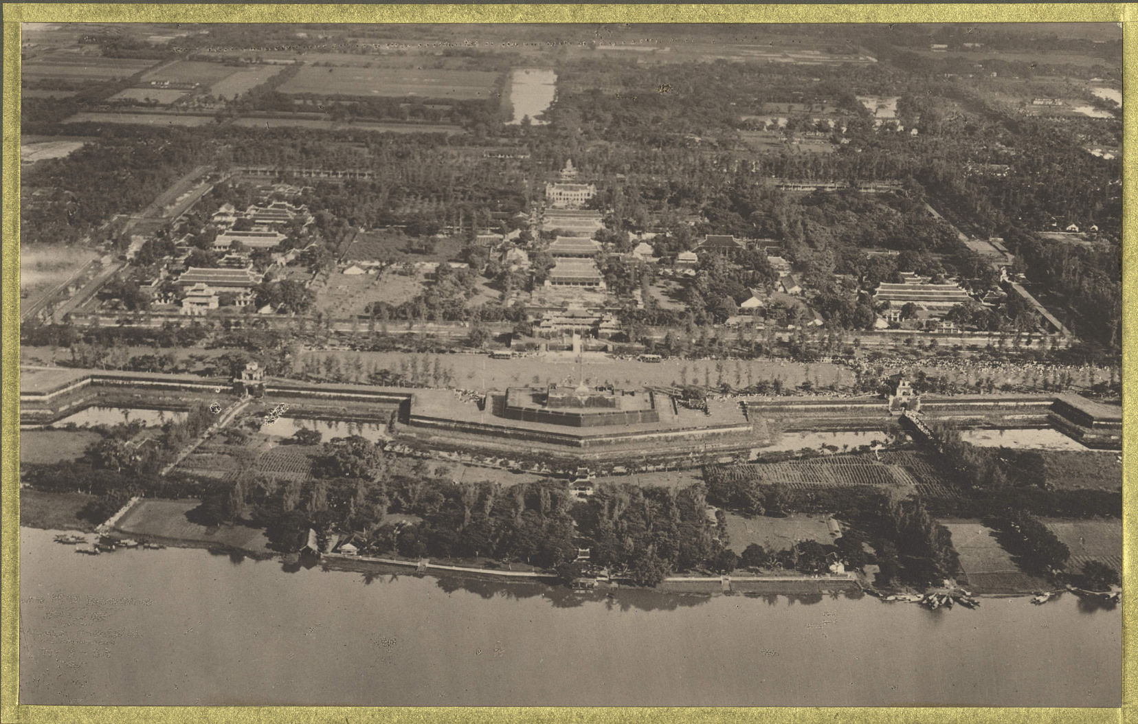
Hue. Palais Impérial.

CENTRE DE DOCUMENTATION ET DE RECHERCHES SUR L'ASIE DU SUD-EST ET LE MONDE INDONESIEN BIBLIOTHÈQUE