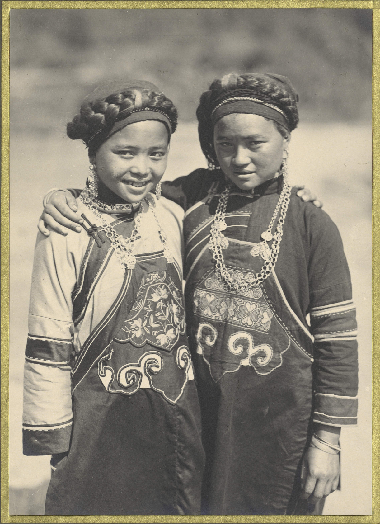
Takha. Filles Tou-La.

CENTRE DE DOCUMENTATION ET DE RECHERCHES SUR L'ASIE DU SUD-EST ET LE MONDE INDONESIEN BIBLIOTHÈQUE