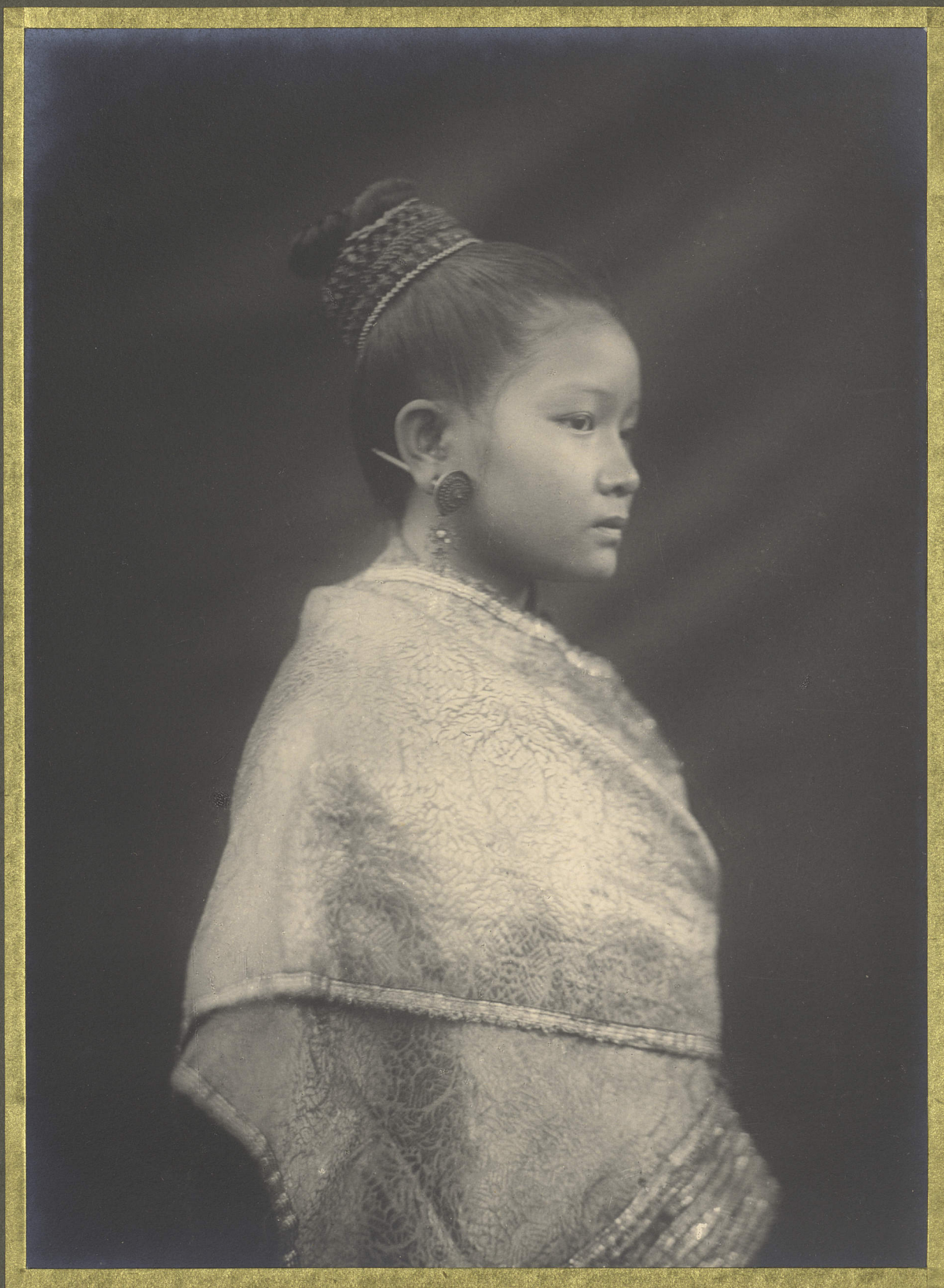
Luang-Prabang. Fille Laotienne.

CENTRE DE DOCUMENTATION ET DE RECHERCHES SUR L'ASIE DU SUD-EST ET LE MONDE INDONESIEN BIBLIOTHÈQUE