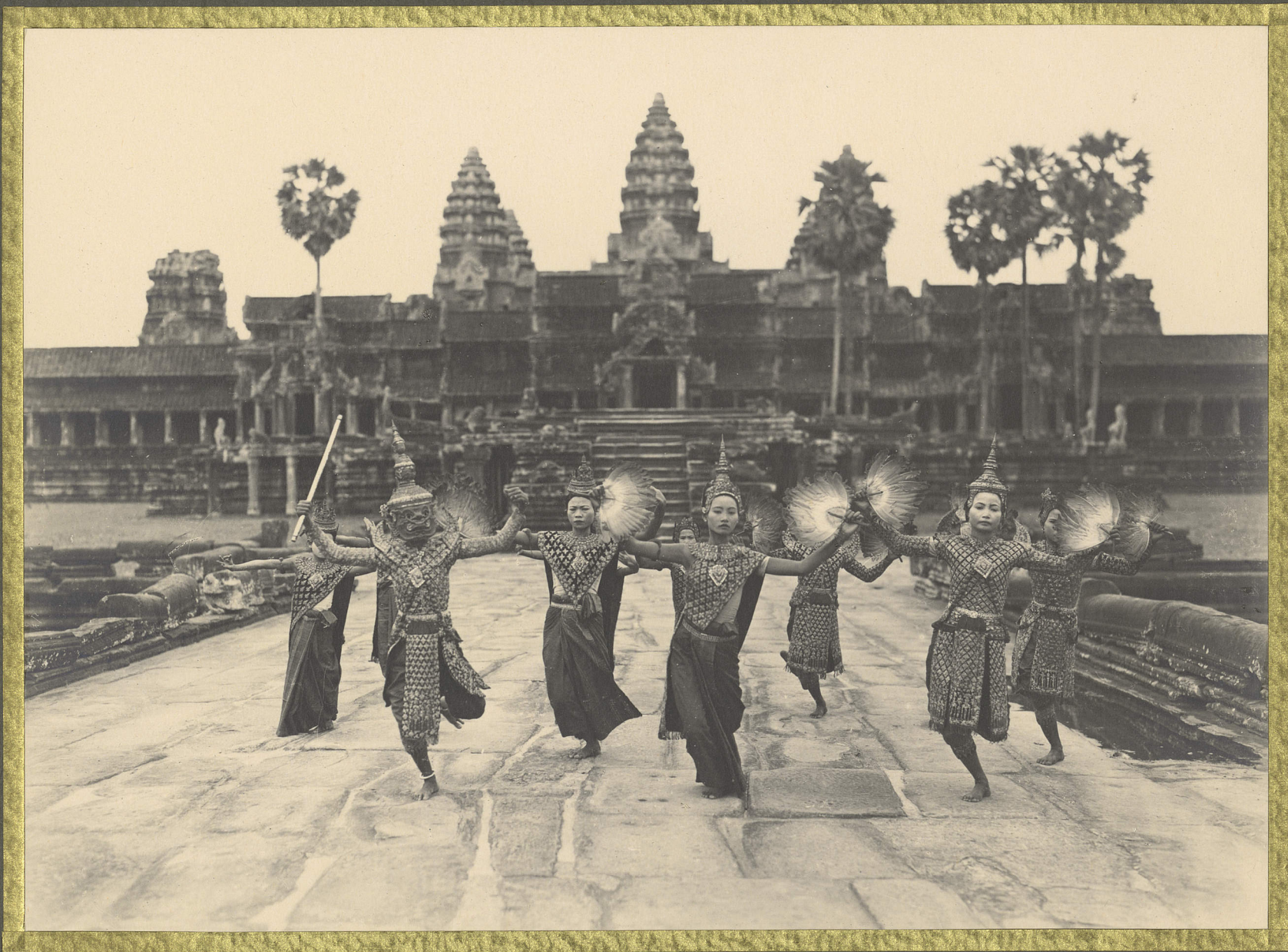
Angkor. Danseuses Cambodgiennes.

CENTRE DE DOCUMENTATION ET DE RECHERCHES SUR L'ASIE DU SUD-EST ET LE MONDE INDONESIEN BIBLIOTHÈQUE