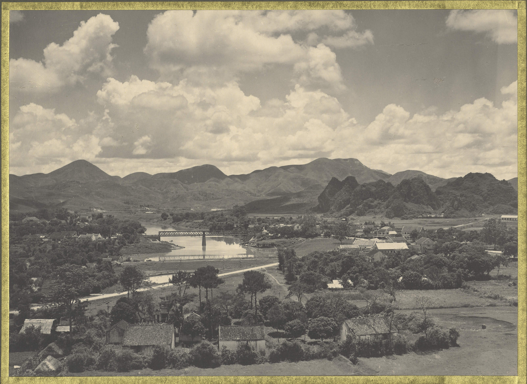
Lang-Son. Vue panoramique.