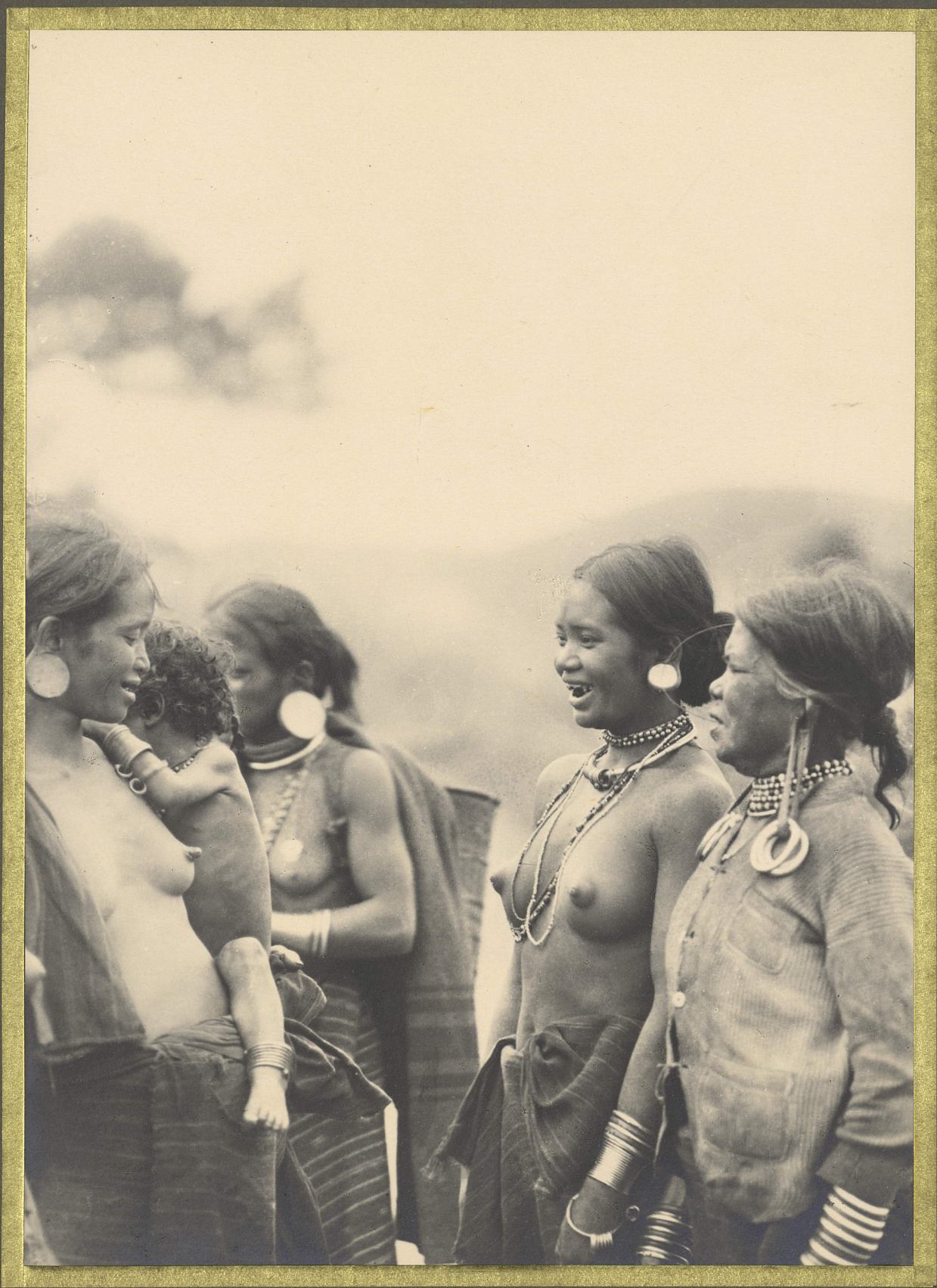
Dalat. Femmes Noies

CENTRE DE DOCUMENTATION ET DE RECHERCHES SUR L'ASIE DU SUD-EST ET LE MONDE INDONESIEN BIBLIOTHEQUE