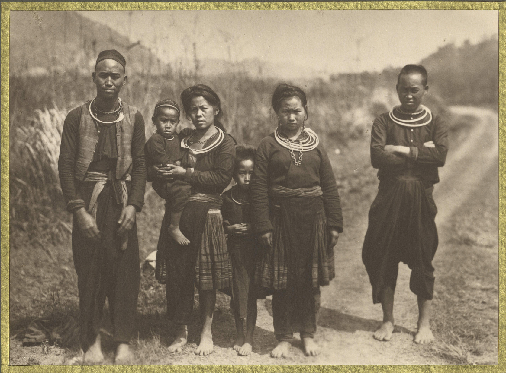
Cran-Minh. Types de Miao.

CENTRE DE DOCUMENTATION ET DE RECHERCHES SUR L'ASIE DU SUD-EST ET LE MONDE INDONESIEN BIBLIOTHÈQUE