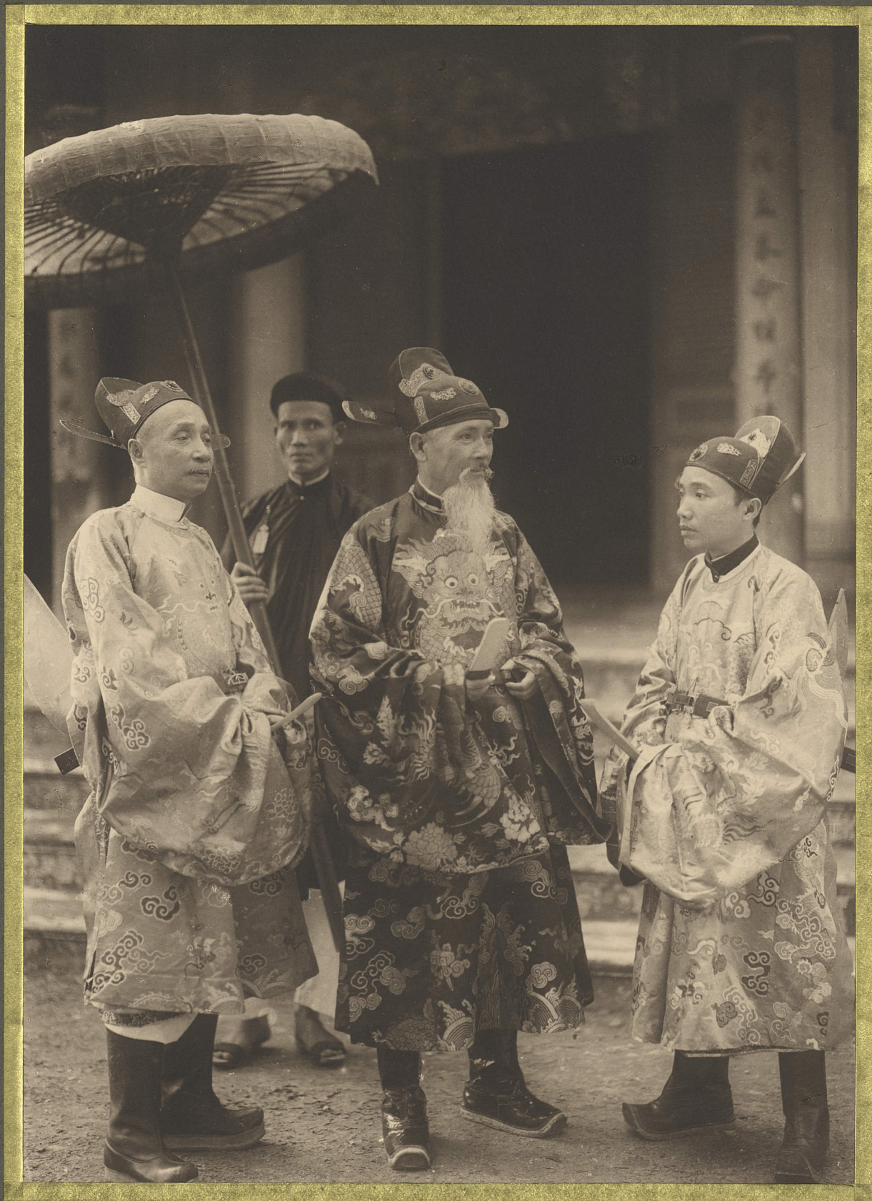
Huic. Les mandarins de la Cour d'Annam.

CENTRE DE DOCUMENTATION ET DE RECHERCHES SUR L'ASIE DU SUD-EST ET LE MONDE INDONESIEN BIBLIOTHEQUE