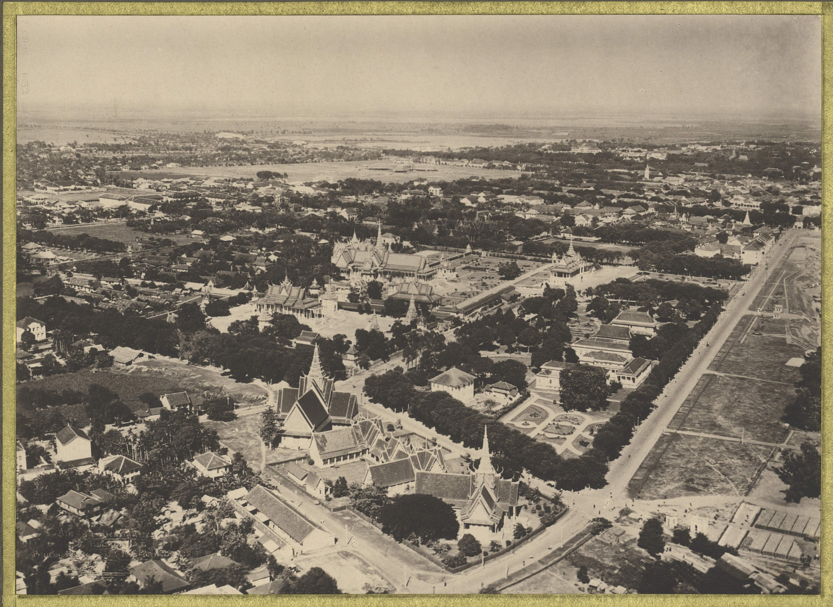
Phnom-Penh. Le Palais Royal.

CENTRE DE DOCUMENTATION ET DE RECHERCHES SUR L'ASIE DU SUD-EST ET LE MONDE INDONESIEN BIBLIOTHÈQUE