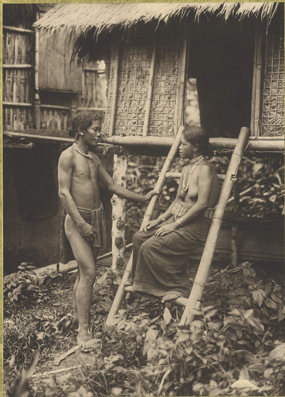
Taksi. Homme et femme Iha.

ET DE DOCUMENTATION CENTRE DE DOCUMENTATION ET DE RECHERCHES SUR L'ASIE DU SUD-EST ET LE MONDE INDONESIEN BIBLIOTHEQUE