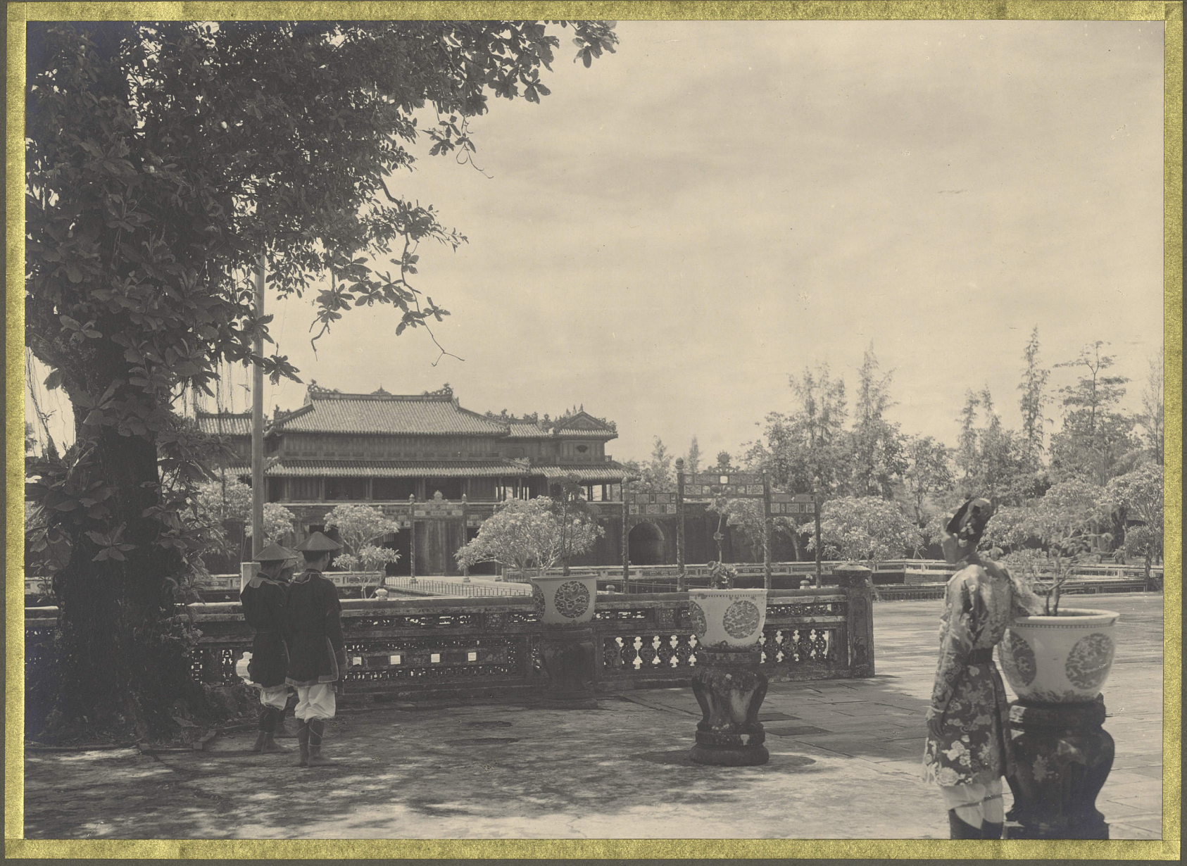
Huế . Vue du Palais Chai-Hoa vers la Porte Ngo-Môn .