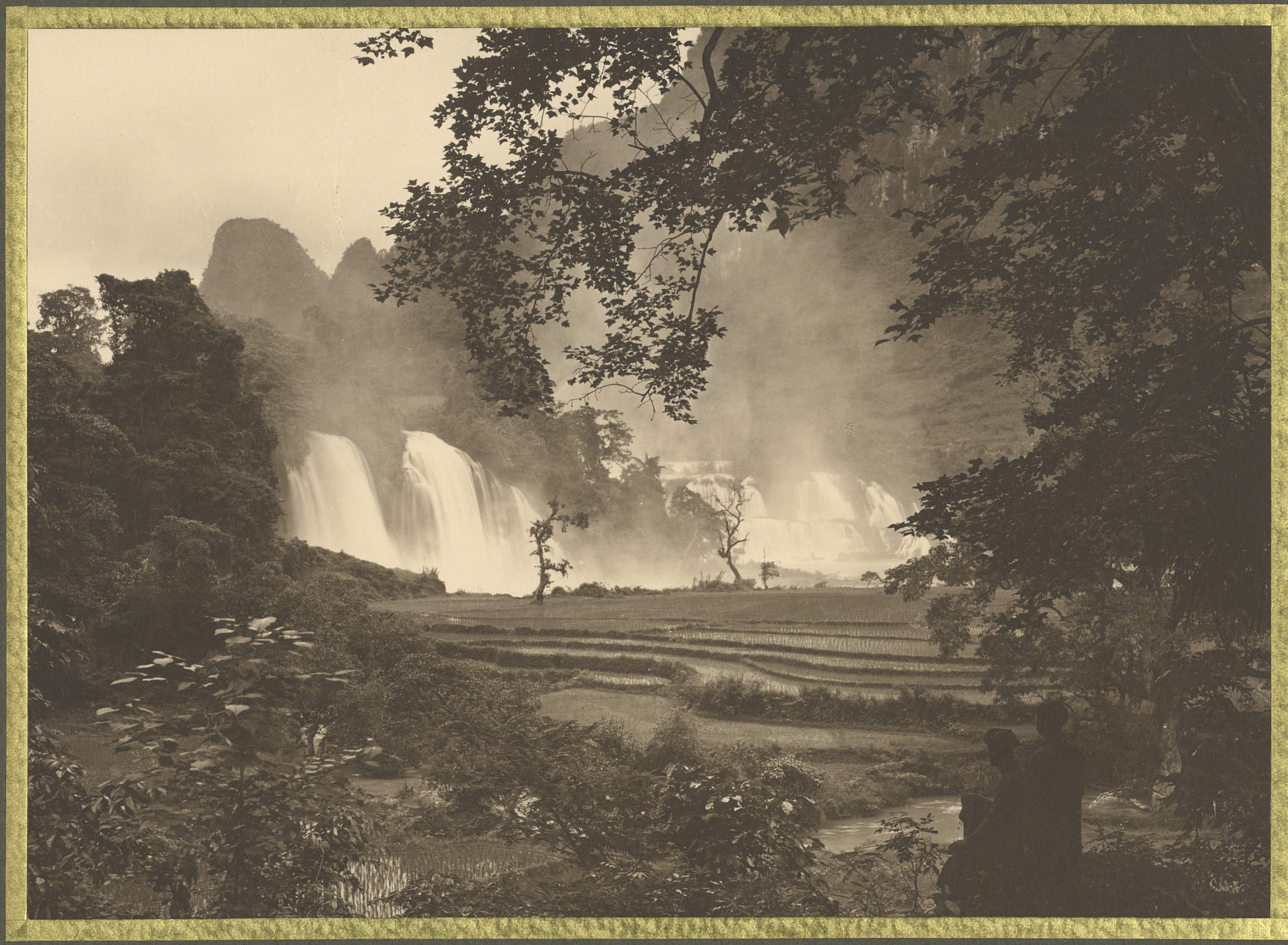
Cao-Bãng . Chũtes de Ban-Giỗc .