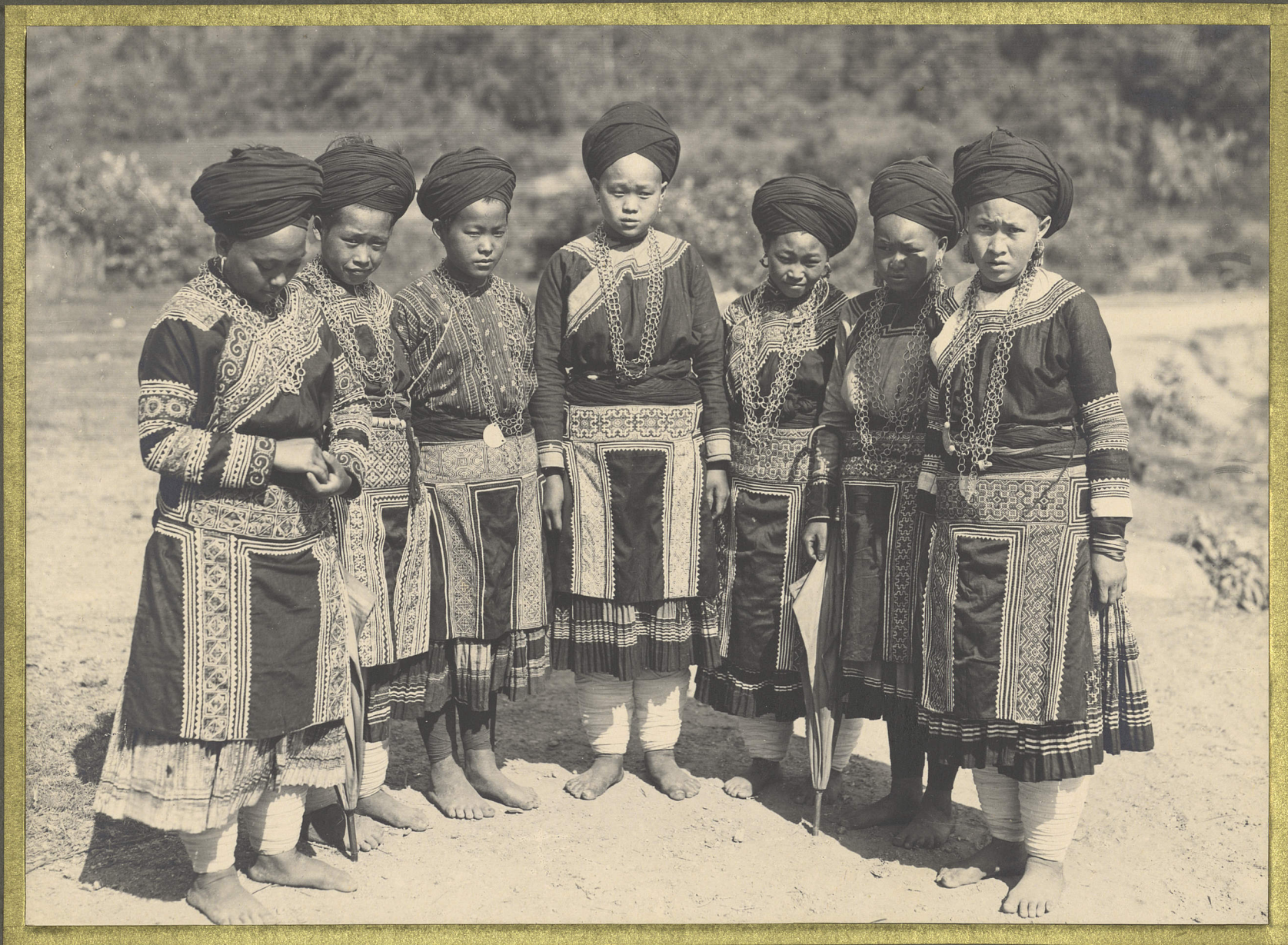
Takha. Femmes Mboe à fleurs.

CENTRE DE DOCUMENTATION ET DE RECHERCHES SUR L'ASIE DU SUD-EST ET LE MONDE INDONESIEN BIBLIOTHÈQUE