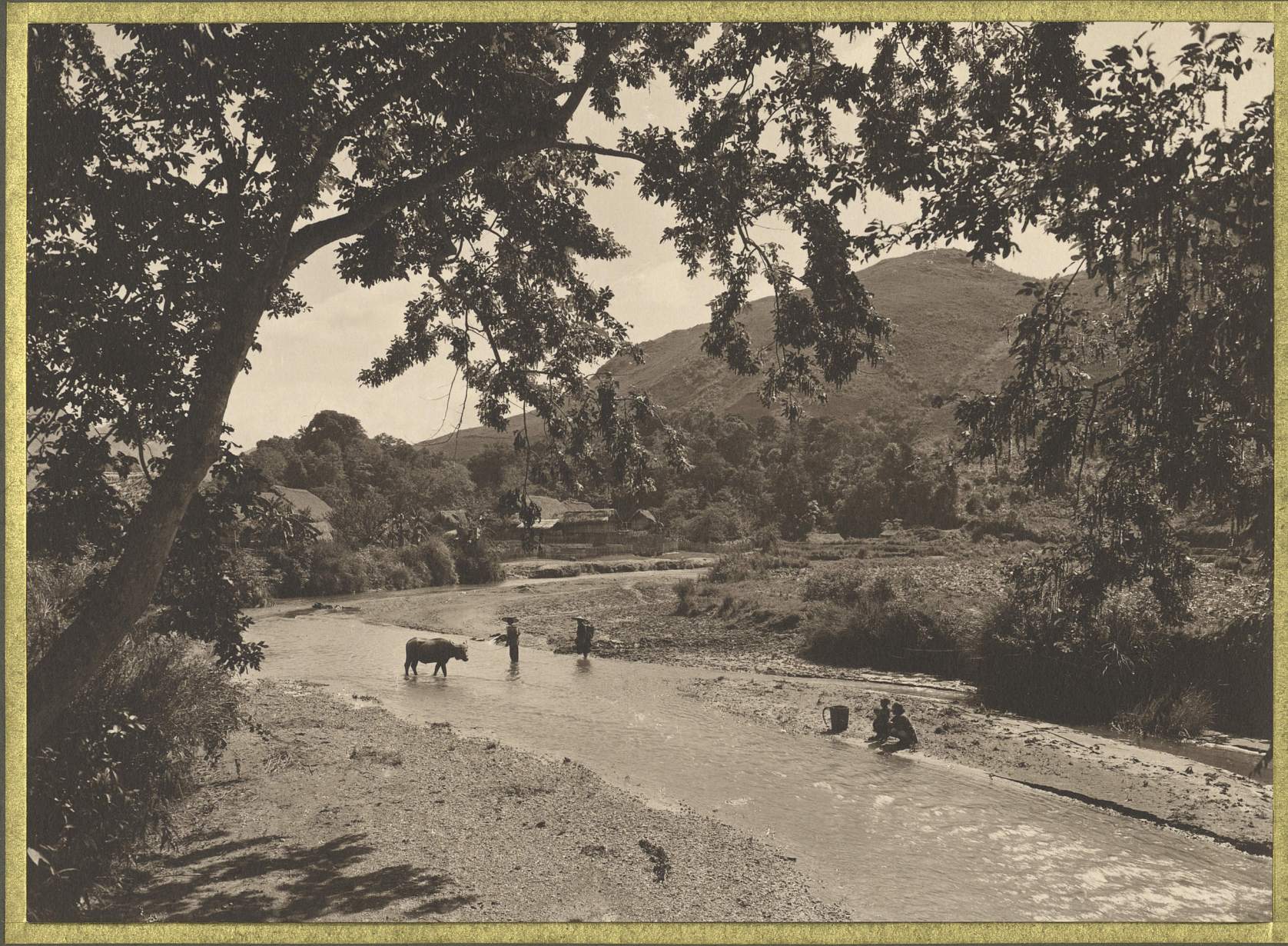
Jakha . La rivière .

CENTRE DE DOCUMENTATION ET DE RECHERCHES SUR L'ASIE DU SUD-EST ET LE MONDE INDONESIEN BIBLIOTHÈQUE