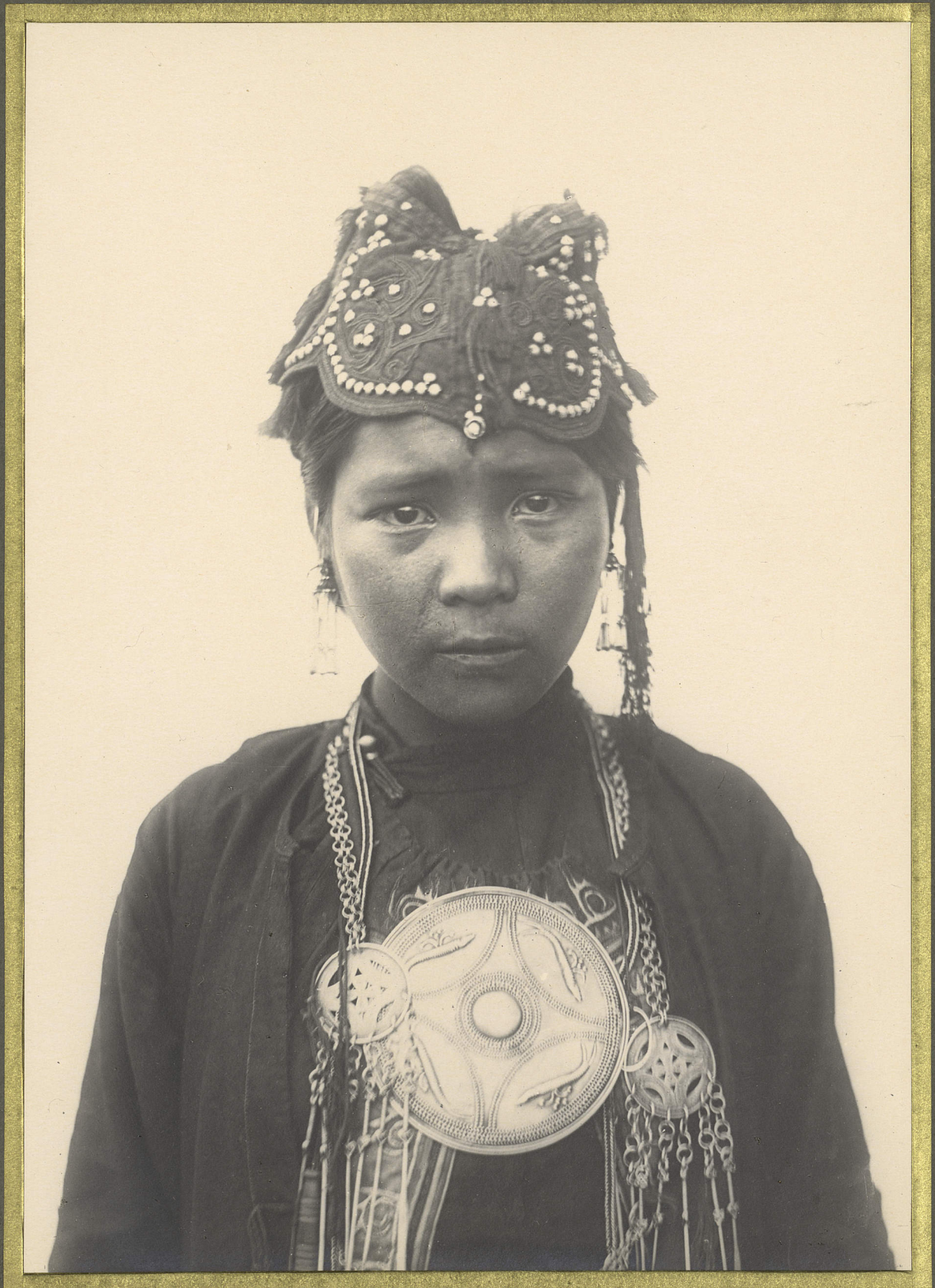
Laos-Hay. Femme Ou-Ni.

CENTRE DE DOCUMENTATION ET DE RECHERCHES SUR L'ASIE DU SUD-EST ET LE MONDE INDONESIEN BIBLIOTHEQUE