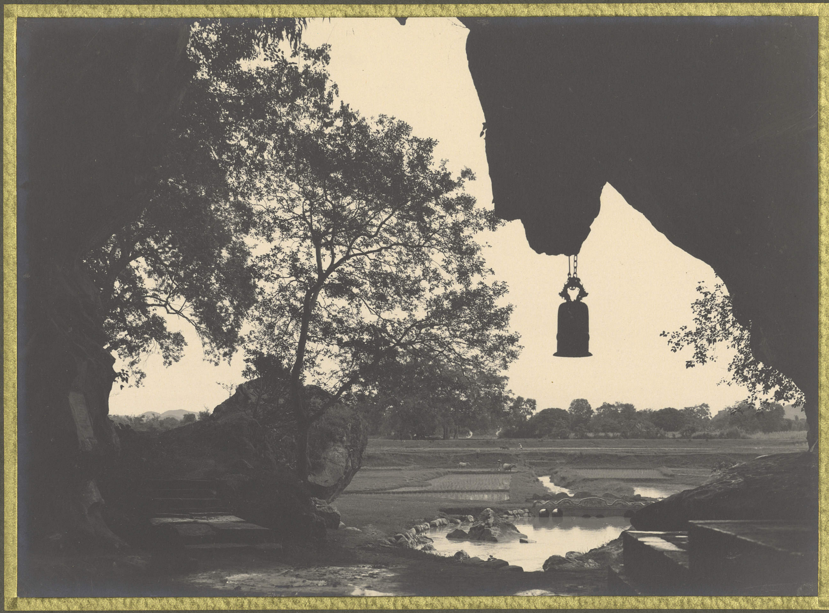
Lang-Son . Grotte de Ichi-Shank .