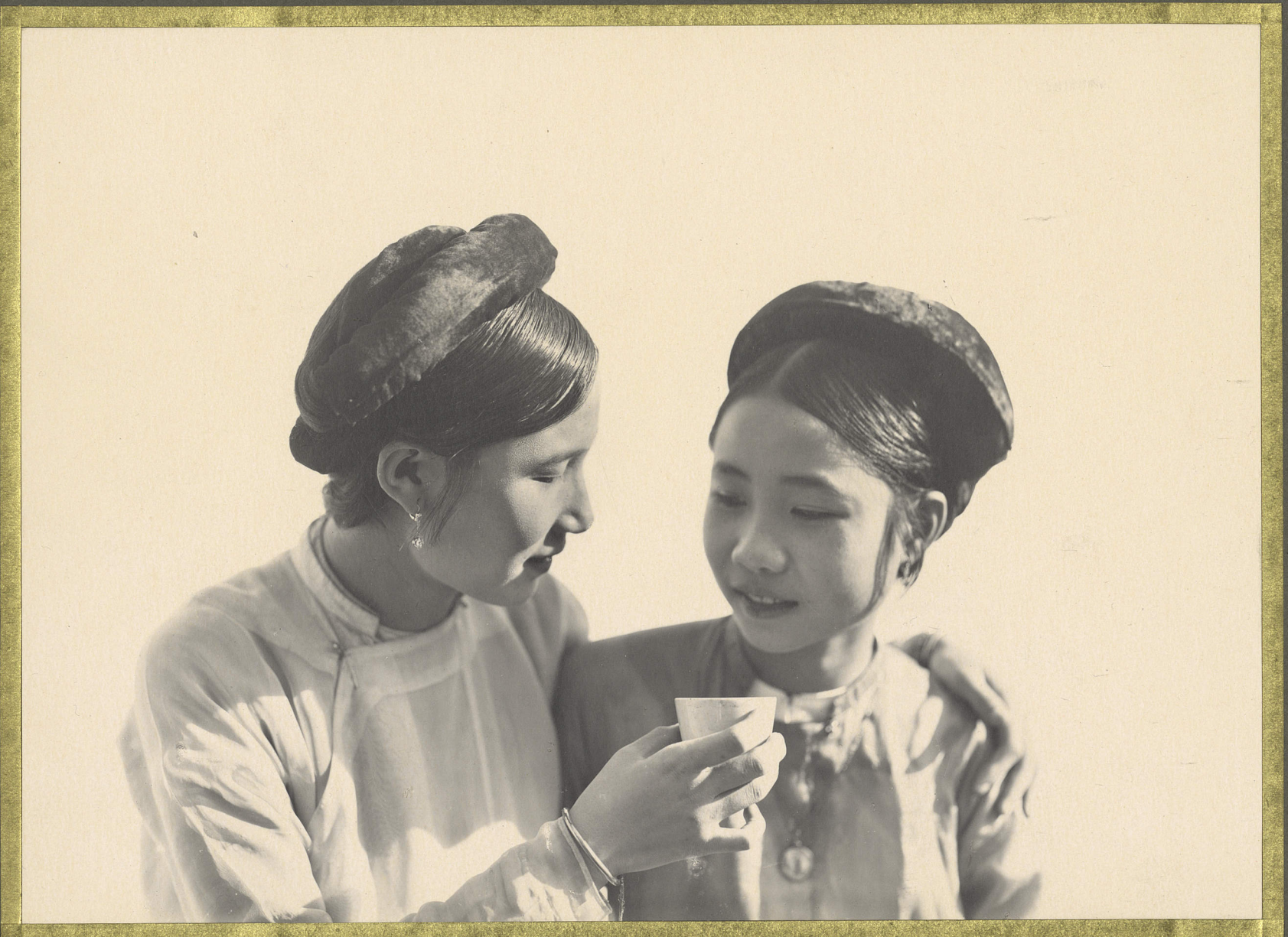
Hanoi. Jeunes Cochinoises.

CENTRE DE DOCUMENTATION ET DE RECHERCHES SUR L'ASIE DU SUD-EST ET LE MONDE INDONESIEN BIBLIOTHÈQUE