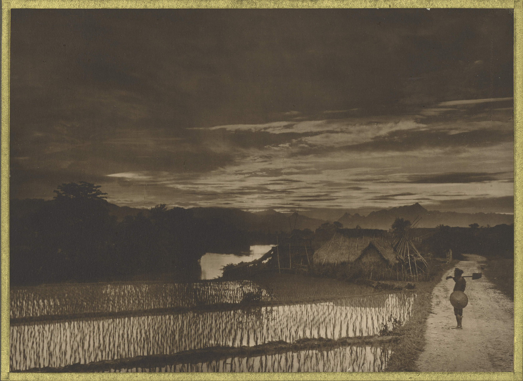
Cao-Binh . Coucher de soleil sur le sông Éoc-Lao .

CENTRE DE DOCUMENTATION ET DE RECHERCHES SUR L'ASIE DU SUD-EST ET LE MONDE INDONESIEN BIBLIOTHEQUE