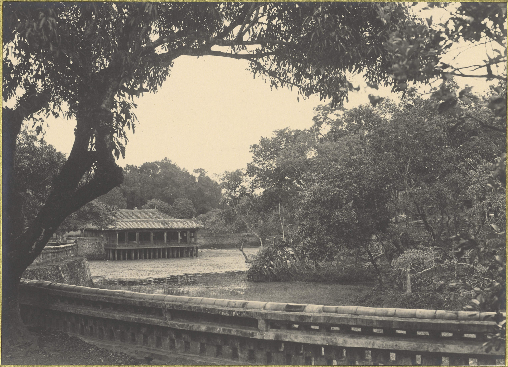
Huê. Tombeau de l'Empereur Minh-Manh. T. D. V. C. Les bains royaux.