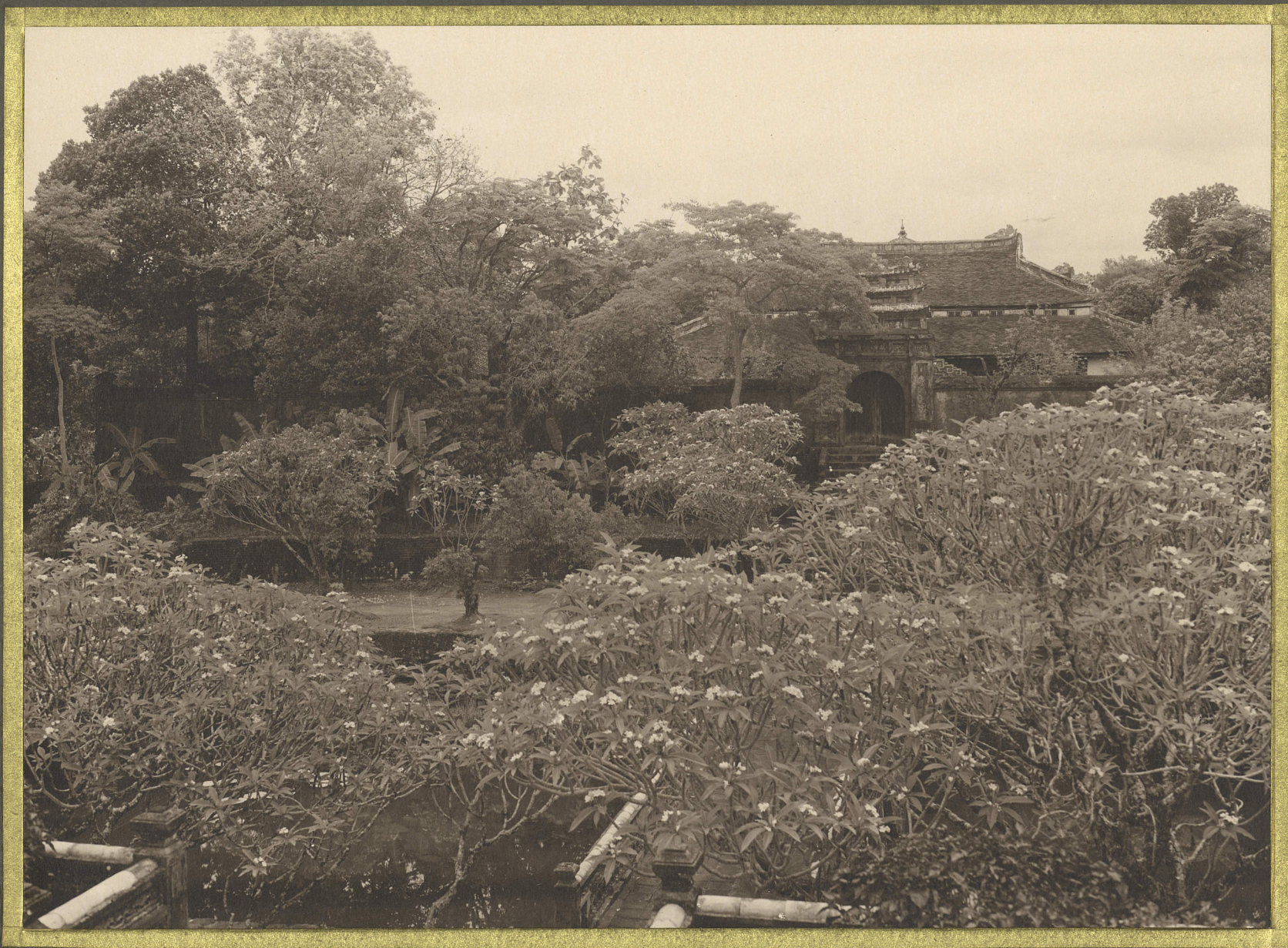
Huê . Tombeau de l'Empereur Minh-Manh . Les jardins .

CENTRE DE DOCUMENTATION ET DE RECHERCHES SUR L'ASIE DU SUD-EST ET LE MONDE INDONESIEN BIBLIOTHÈQUE