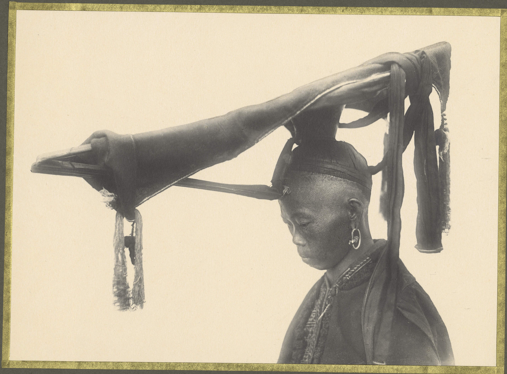
Thong-Cho. Femme Yao-Sin-Tan. Coiffure de mariée.

CENTRE DE DOCUMENTATION ET DE RECHERCHES SUR L'ASIE DU SUD-EST ET LE MONDE INDONESIEN BIBLIOTHEQUE