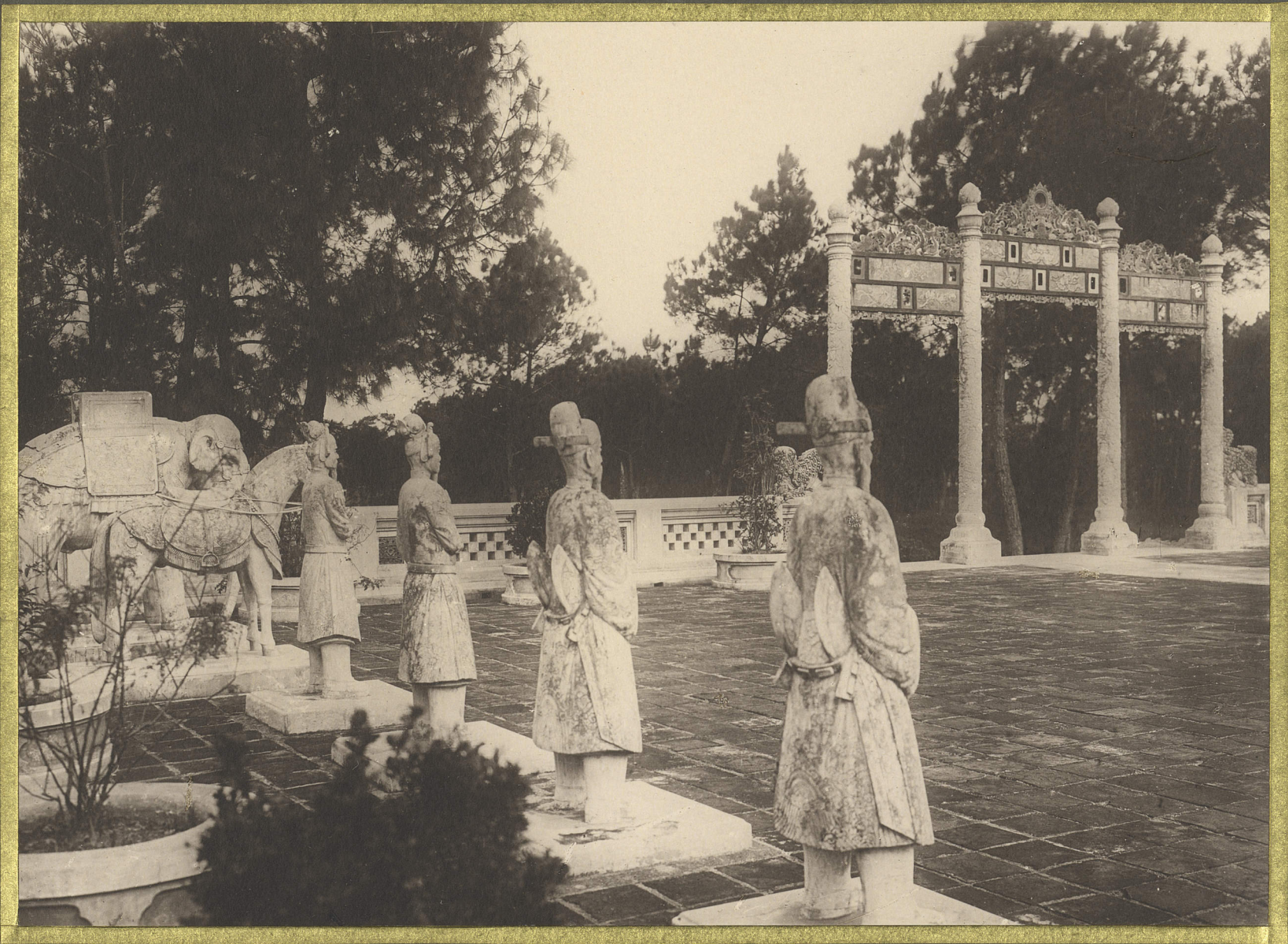
Hue. Tombeau de l'Empereur Dong Khanh. La garde d'honneur.

CENTRE DE DOCUMENTATION ET DE RECHERCHES SUR L'ASIE DU SUD-EST ET LE MONDE INDONESIEN BIBLIOTHÈQUE