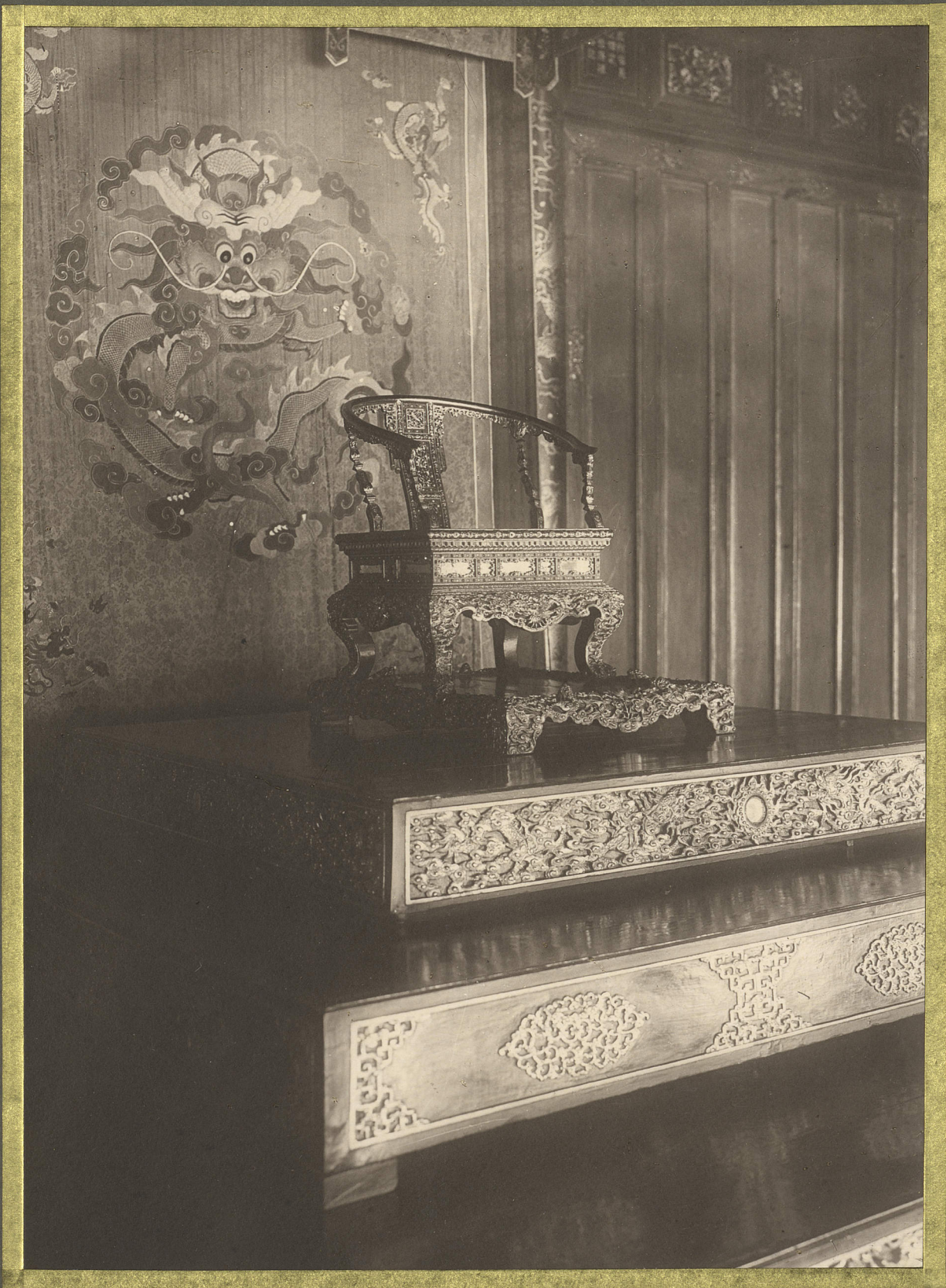
Hu'i. Le Trône Royal.

CENTRE DE DOCUMENTATION ET DE RECHERCHES SUR L'ASIE DU SUD-EST ET LE MONDE INDONESIEN BIBLIOTHEQUE