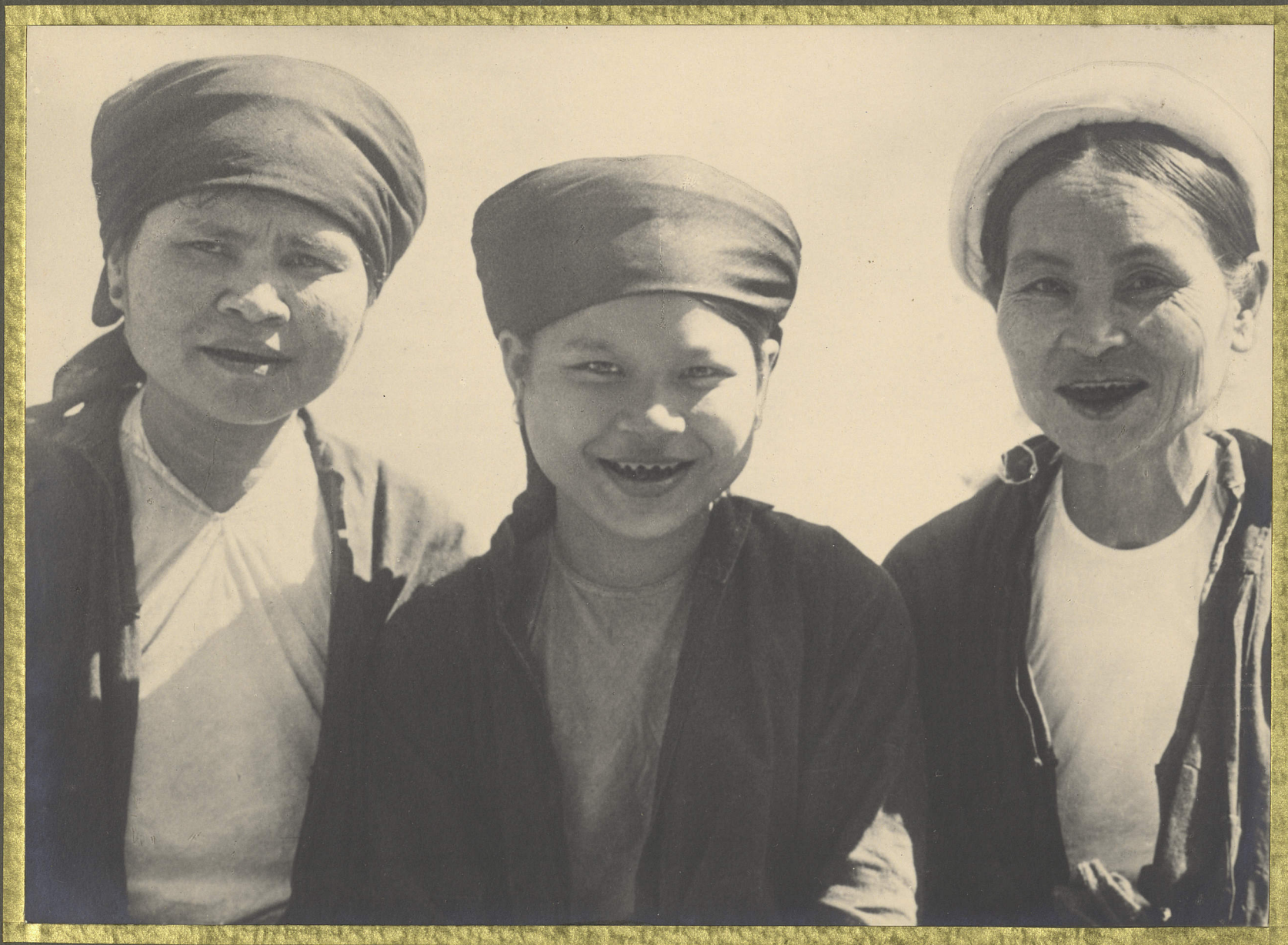
Hadong. Gayames Bonkinoises.

CENTRE DE DOCUMENTATION ET DE RECHERCHES SUR L'ASIE DU SUD-EST ET LE MONDE INDONESIEN BIBLIOTHEQUE