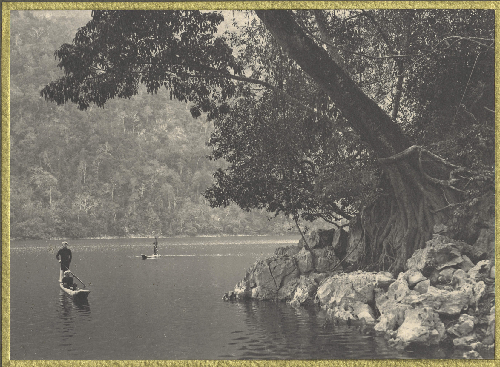
Bae-Kan. Les lao Bobé.