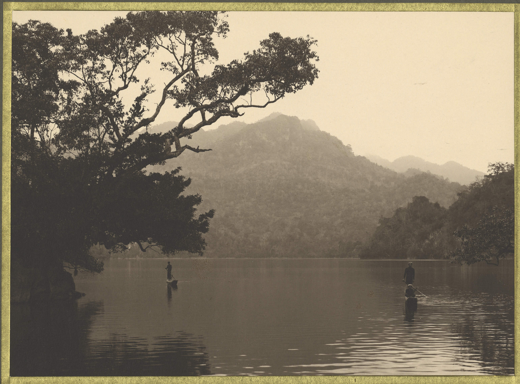
Bac-Hon. Les lacs Babé.