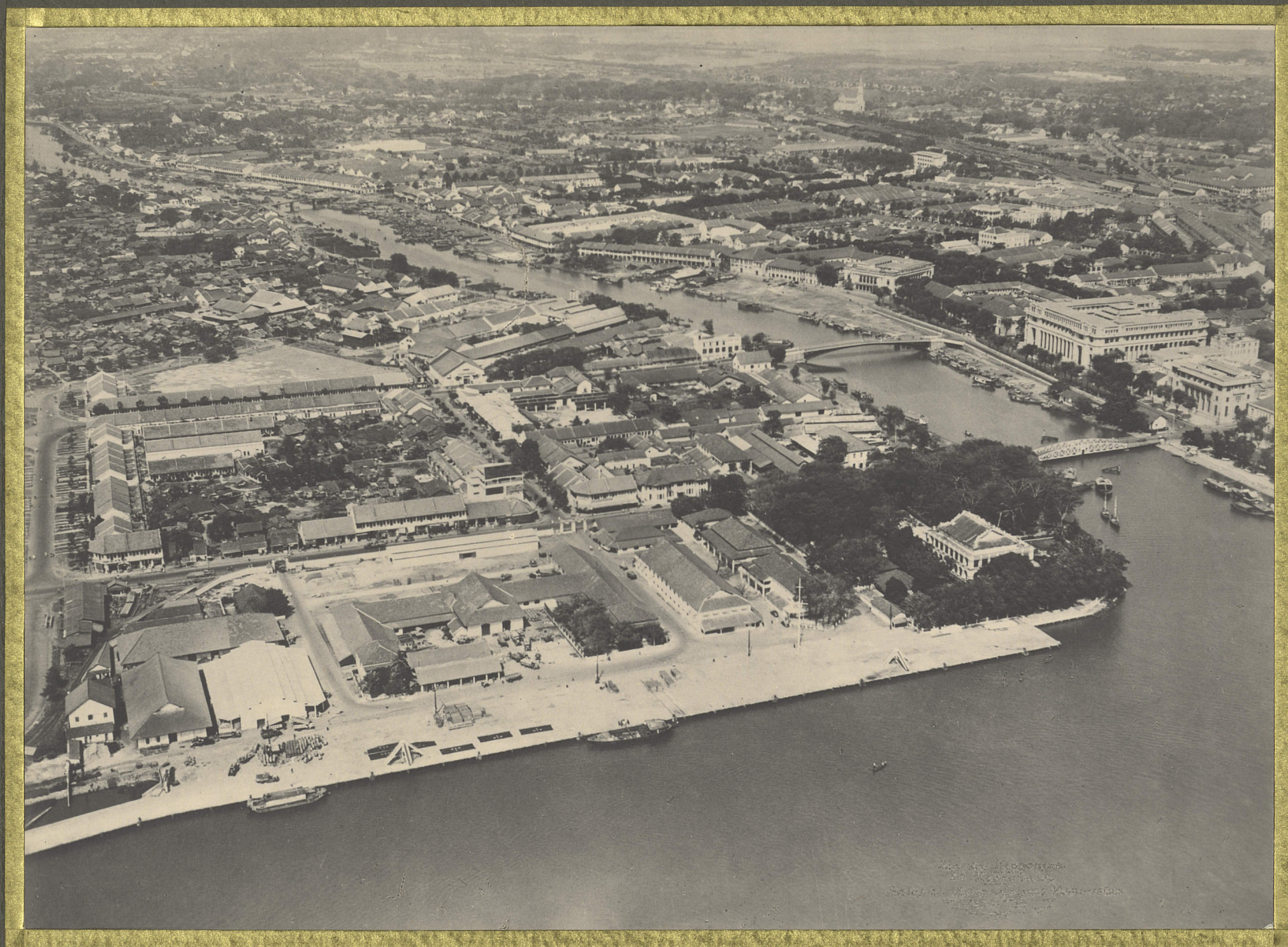
Saigon. Vue générale.