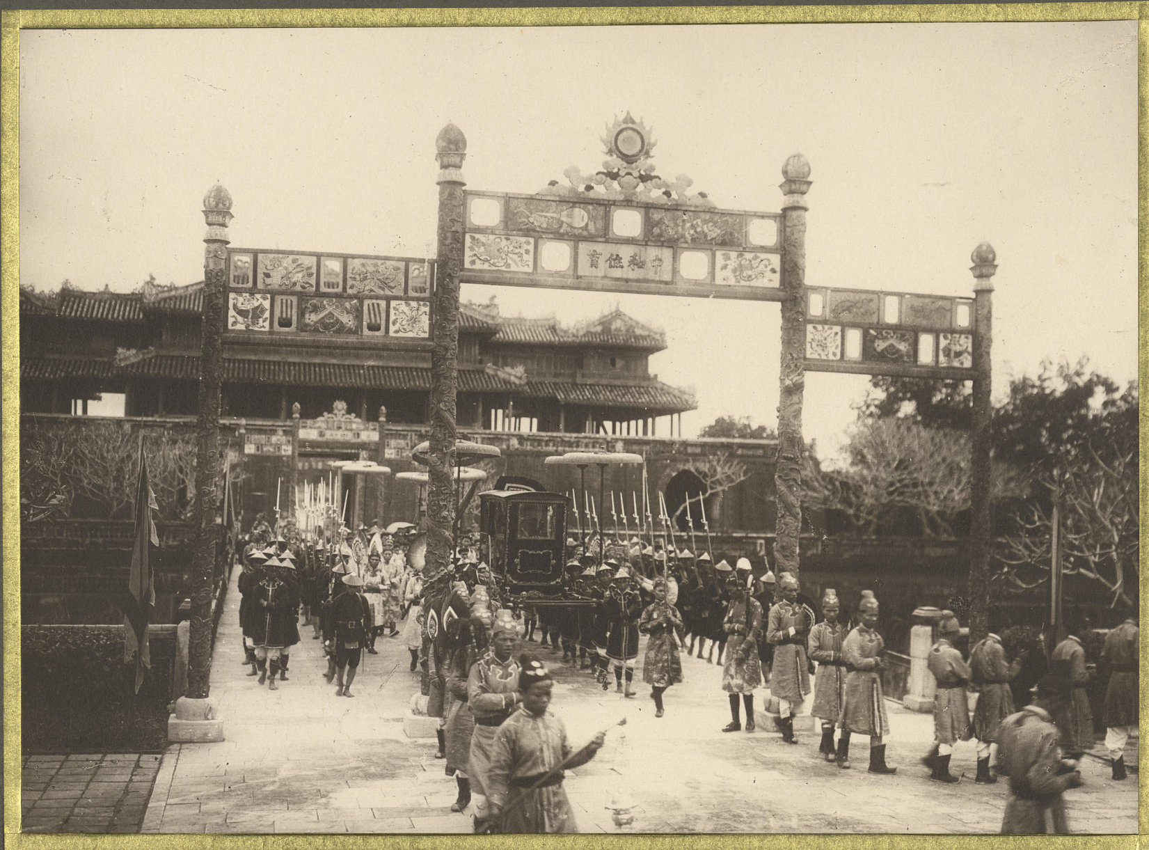
Huè. Le cortège royal.