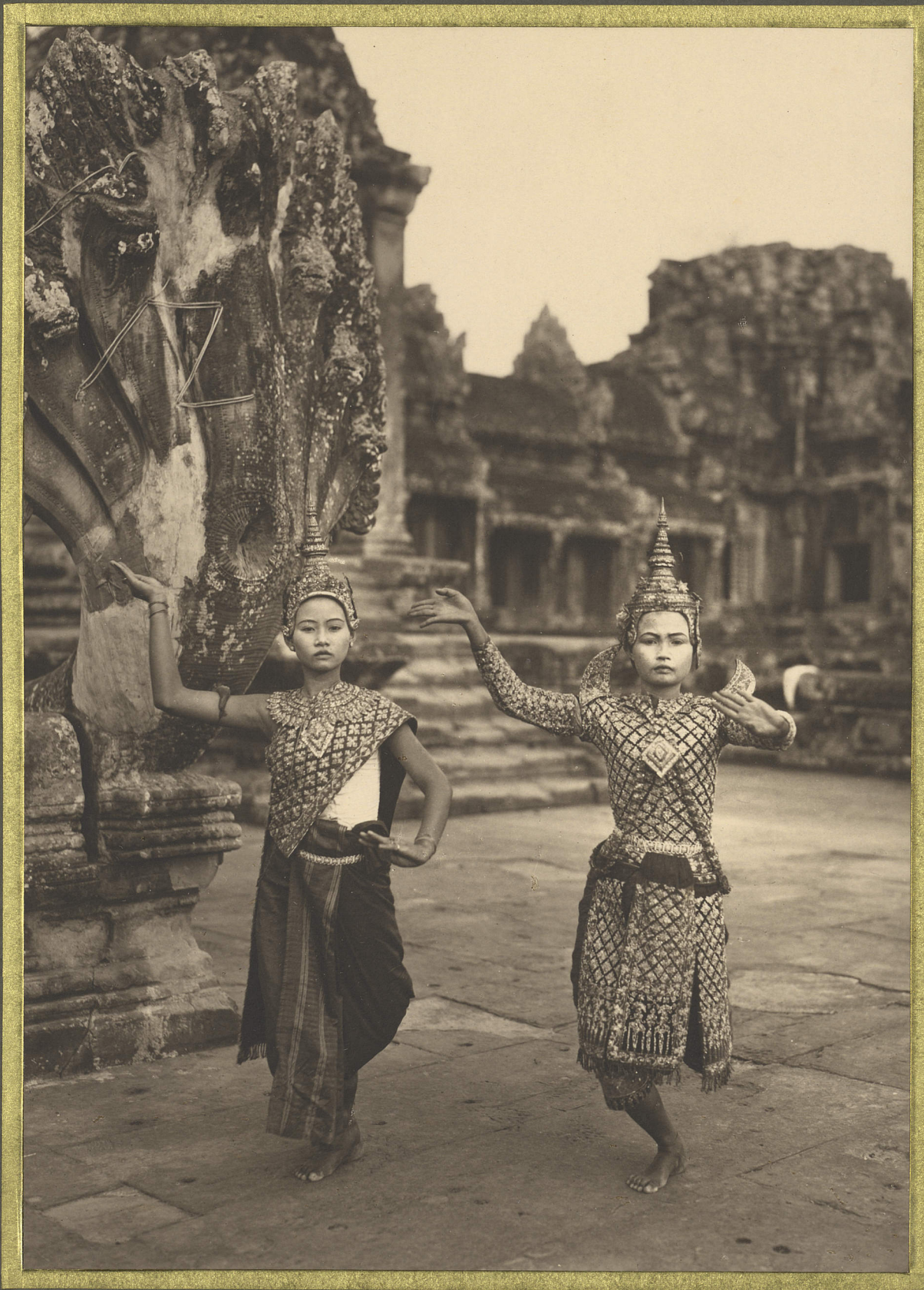
Angkor. Danseuses Cambodgiennes.