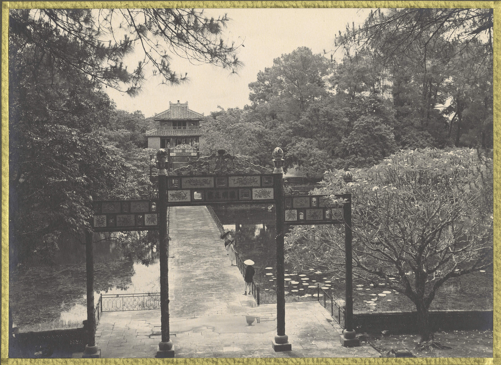
Hué, Tombeau de l'Empereur Minh-Manh. Un portique.

CENTRE DE DOCUMENTATION ET DE RECHERCHES SUR L'ASIE DU SUD-EST ET LE MONDE INDONESIEN BIBLIOTHEQUE