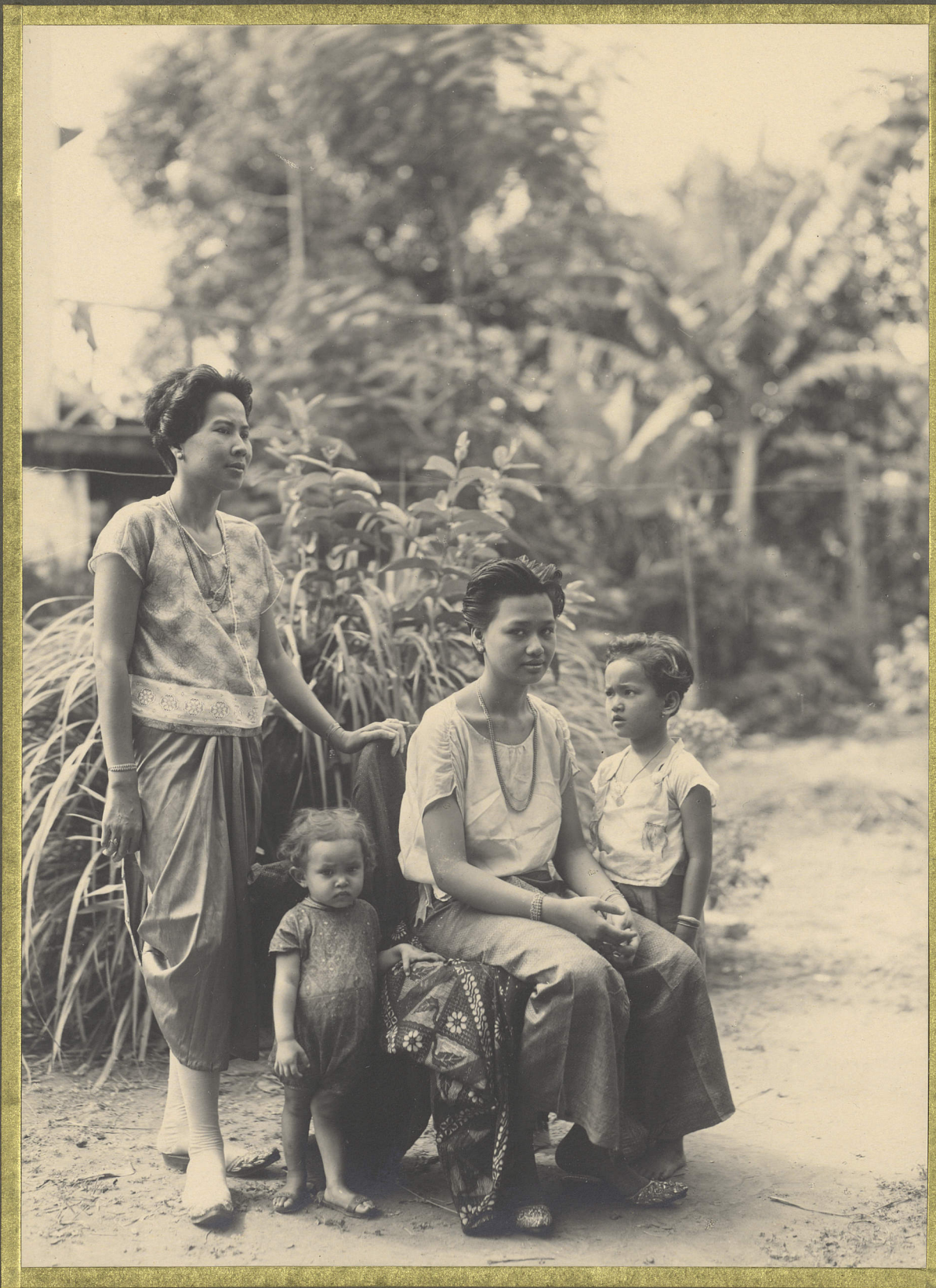
Phnom Penh. Femmes et fillettes Cambodgiennes!

CENTRE DE DOCUMENTATION ET DE RECHERCHES SUR L'ASIE DU SUD-EST ET LE MONDE INDONESIEN BIBLIOTHEQUE