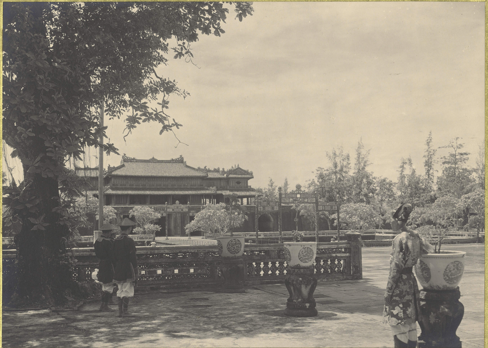
Thưé . Vue du Palais Chái-Hoá vers la Porte Ngô-Môn .