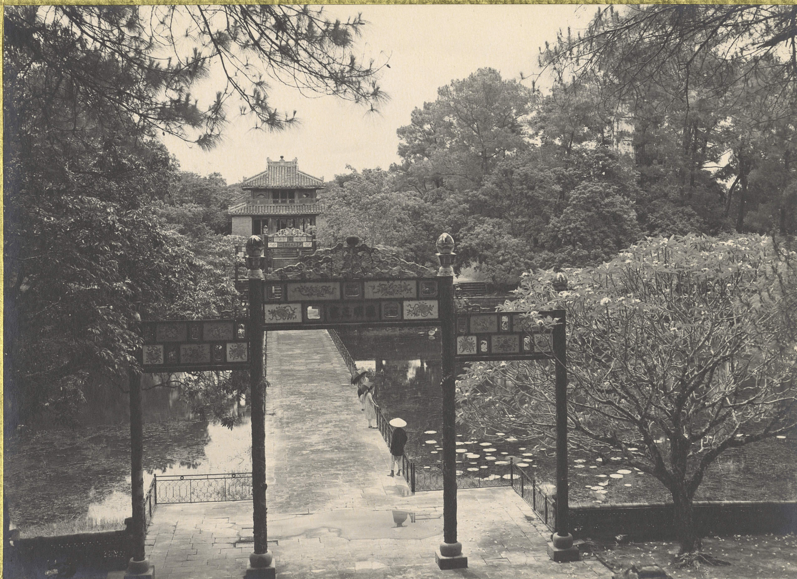
Huê. Tombeau de l'Empereur Minh-Manh. Un portique.