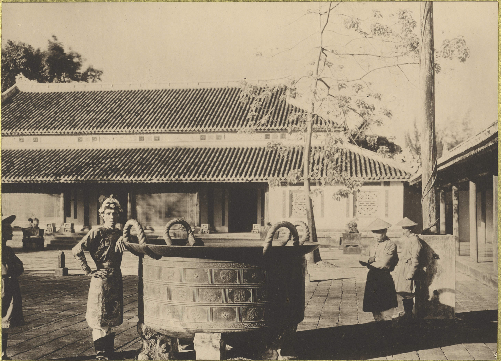
Huế. Une vasque en bronze.