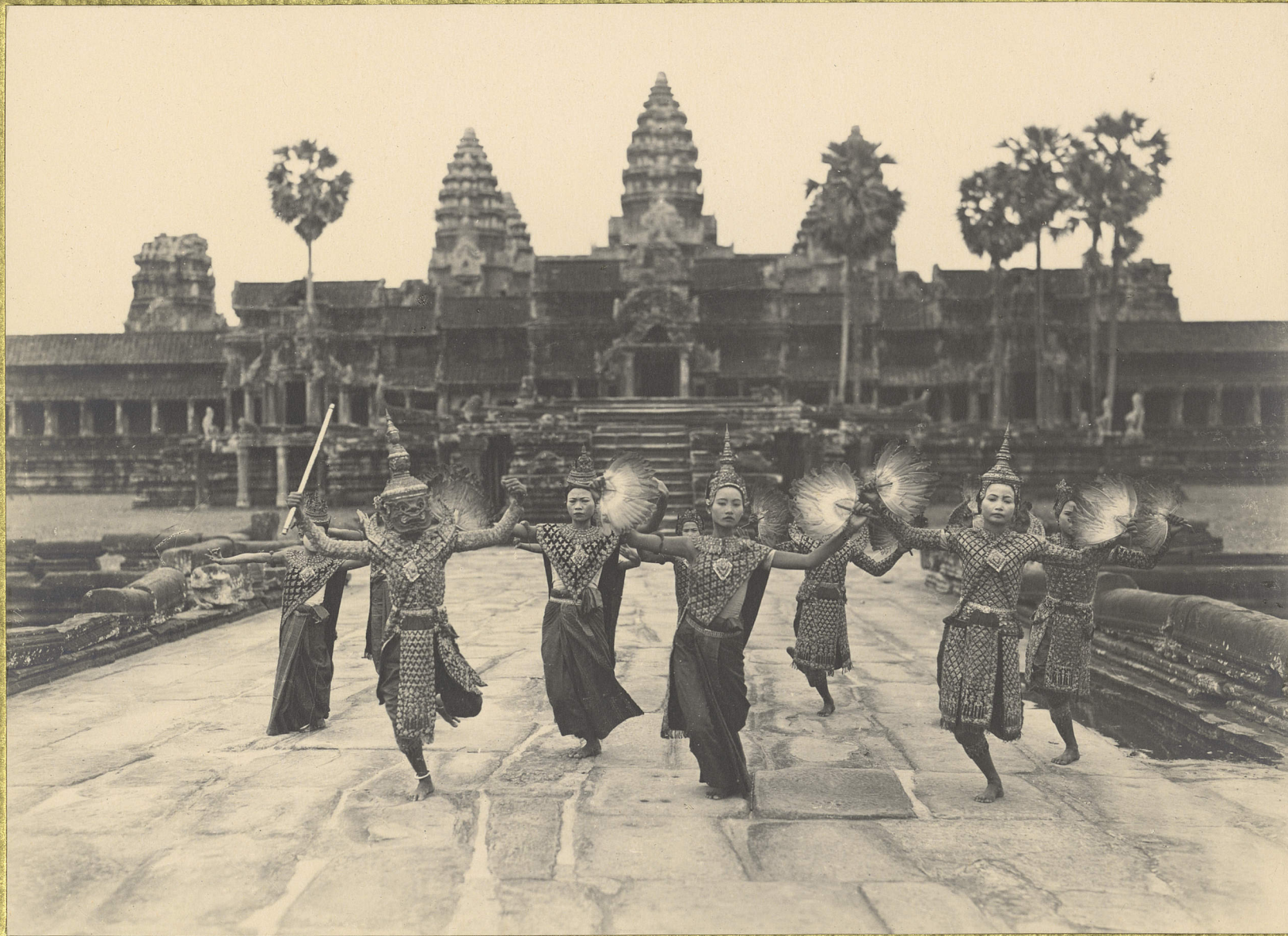
Angkor. Danseuses Cambodgiennes.