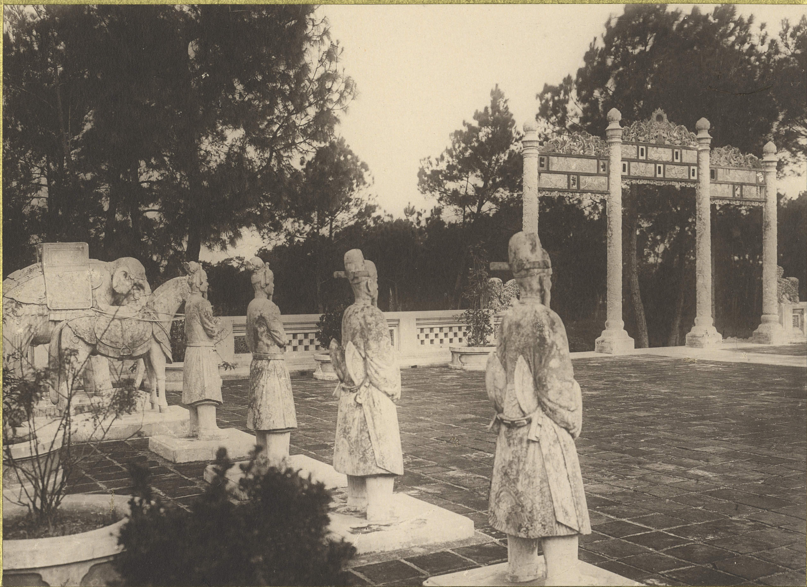
Hue. Tombeau de l'Empereur Dong Khanh. La garde d'honneur.

CENTRE DE DOCUMENTATION ET DE RECHERCHES SUR L'ASIE DU SUD-EST ET LE MONDE INDONESIEN BIBLIOTHÈQUE