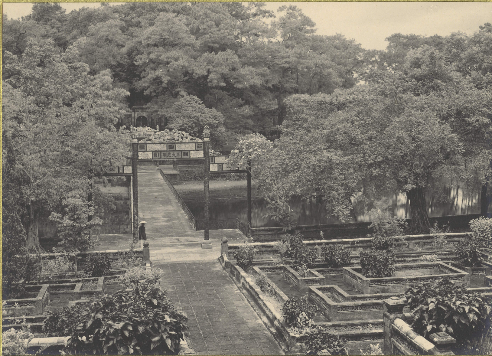
Tombeau de l'Empereur Minh Manh. Au fond: le Tombeau.