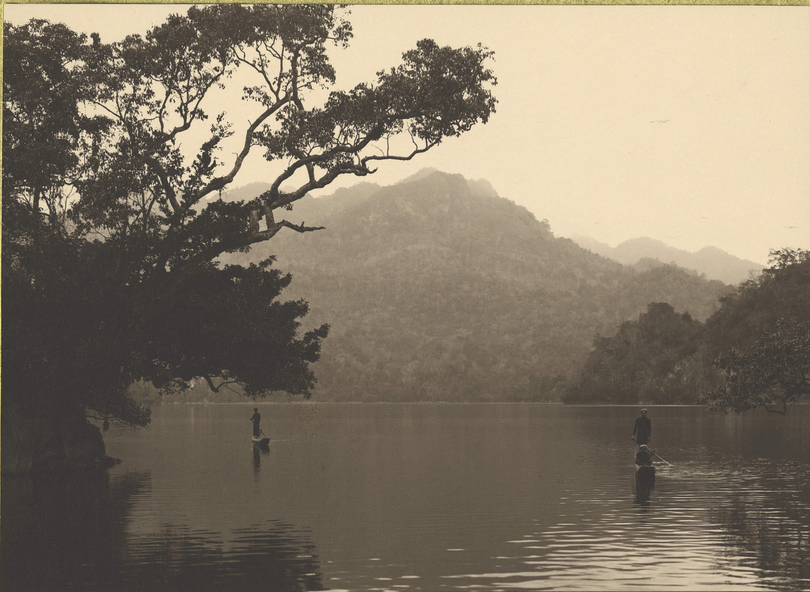
Bac-Hon. Les lacs Babé.