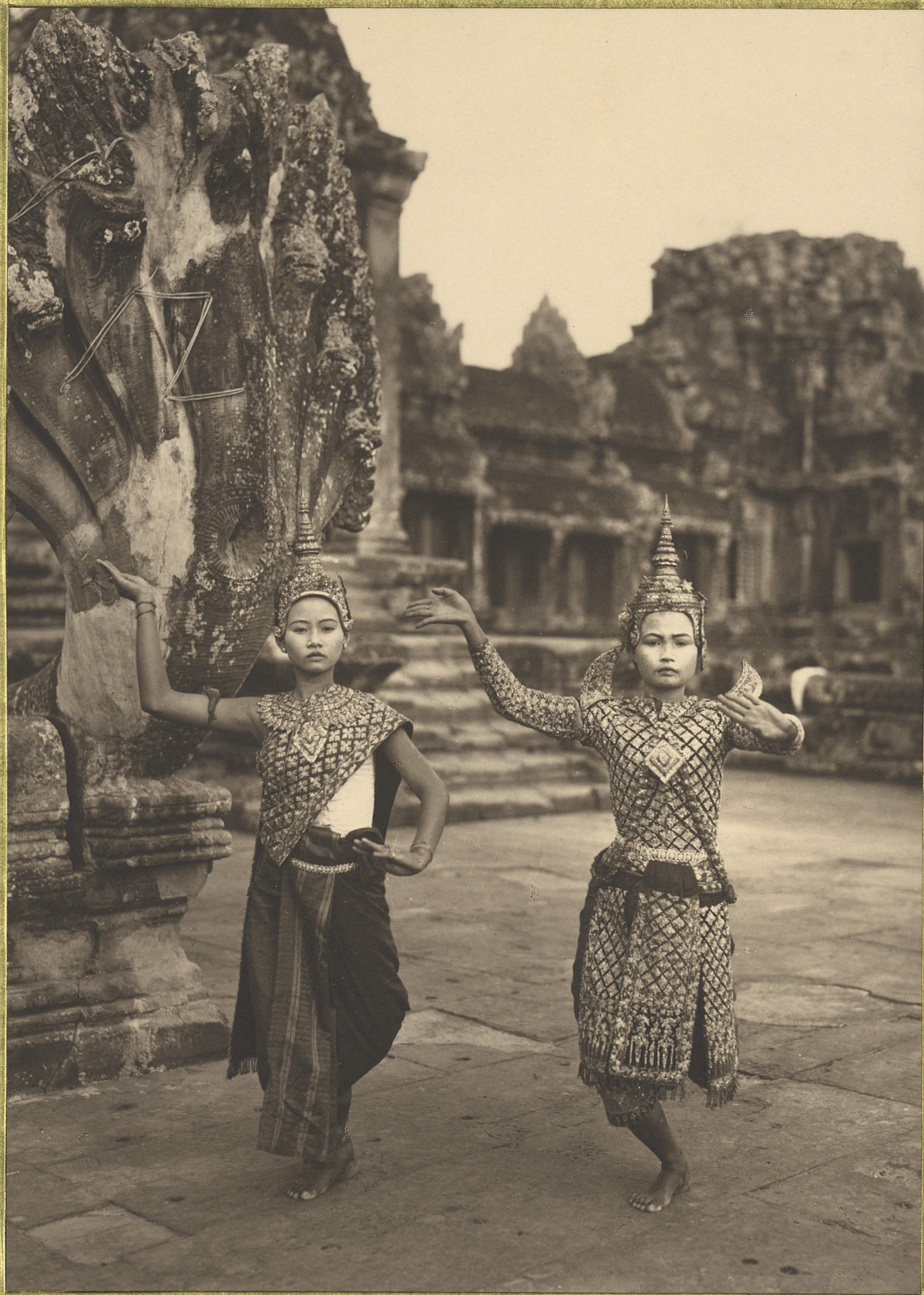
Anaker, Danseuses Cambodgiennes