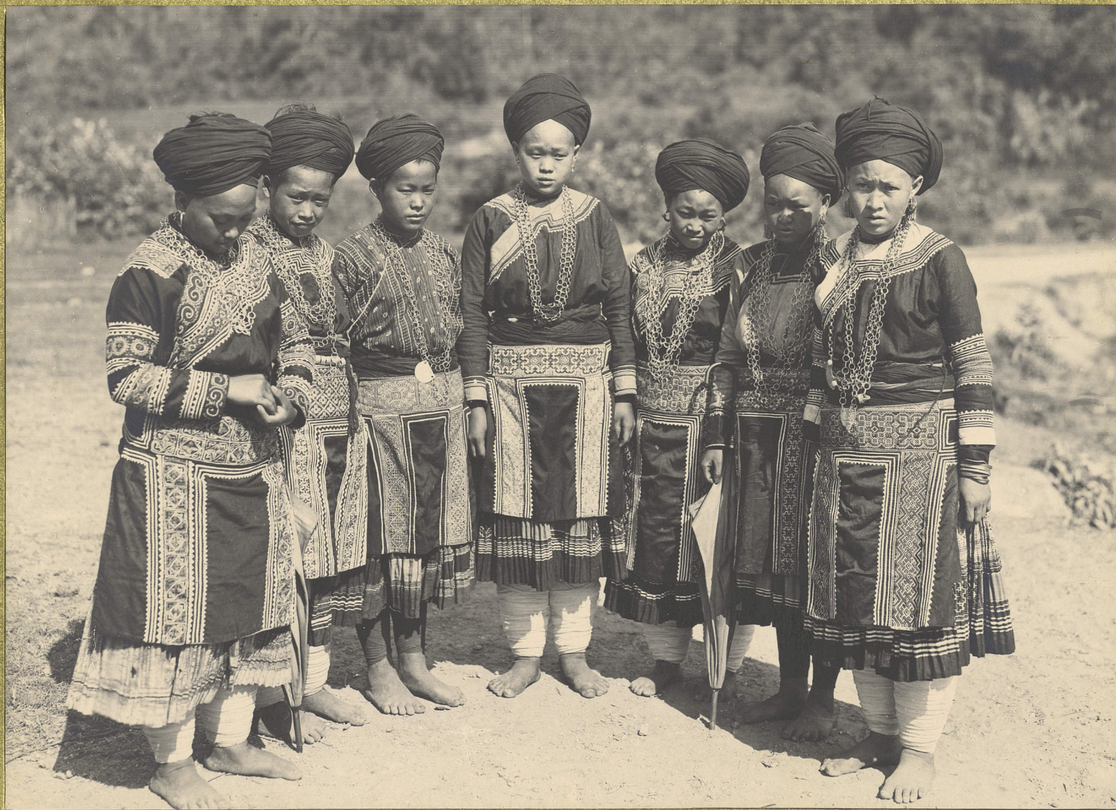
Takha. Femmes Mbéo à fleurs.

CENTRE DE DOCUMENTATION ET DE RECHERCHES SUR L'ASIE DU SUD-EST ET LE MONDE INDONESIEN