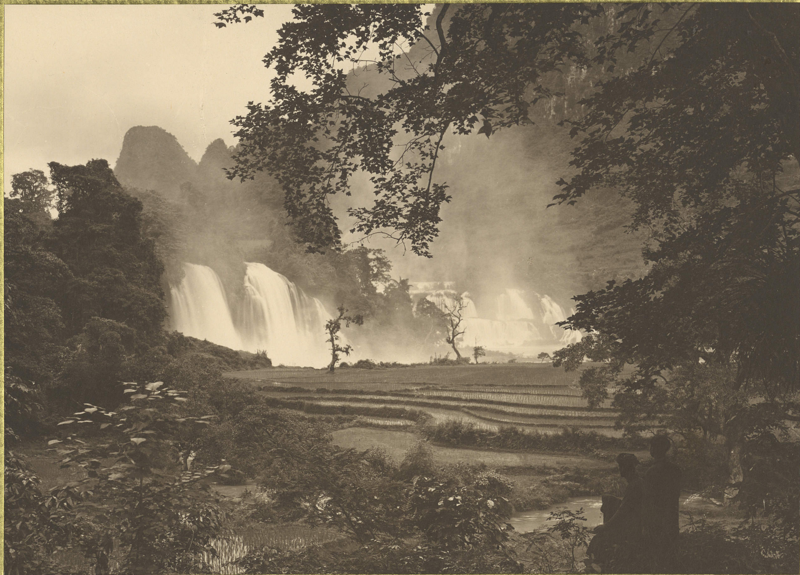
Cao-Bãng . Chutes de Ban-Giéc .

CENTRE DE DOCUMENTATION ET DE RECHERCHES SUR L'ASIE DU SUD-EST ET LE MONDE INDONÉSIEEN BIBLIOTHEQUE