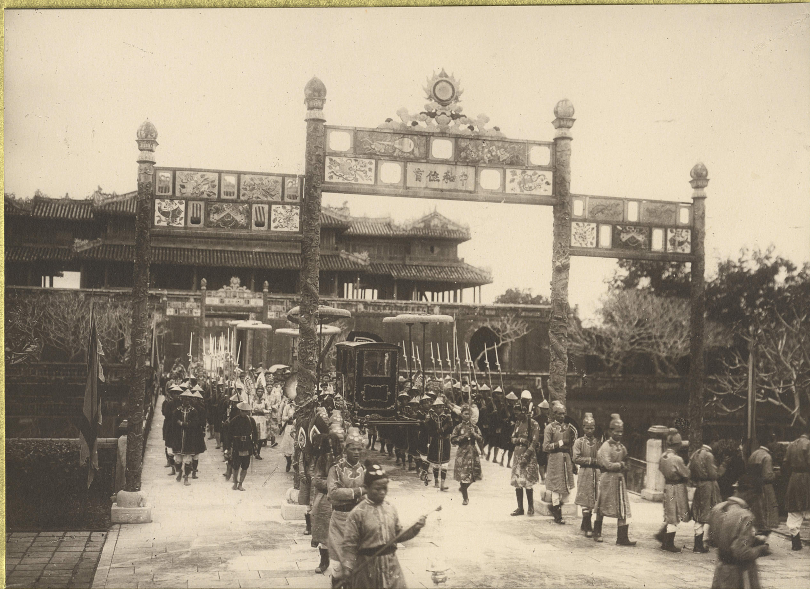
Huế. Le cortège royal.