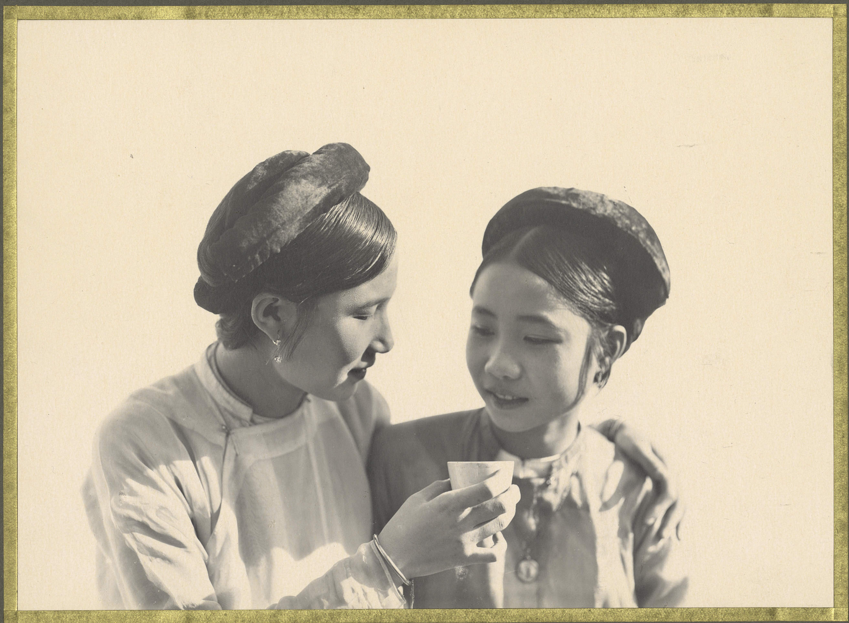
Hanoi. Jeunes Conkinoises.