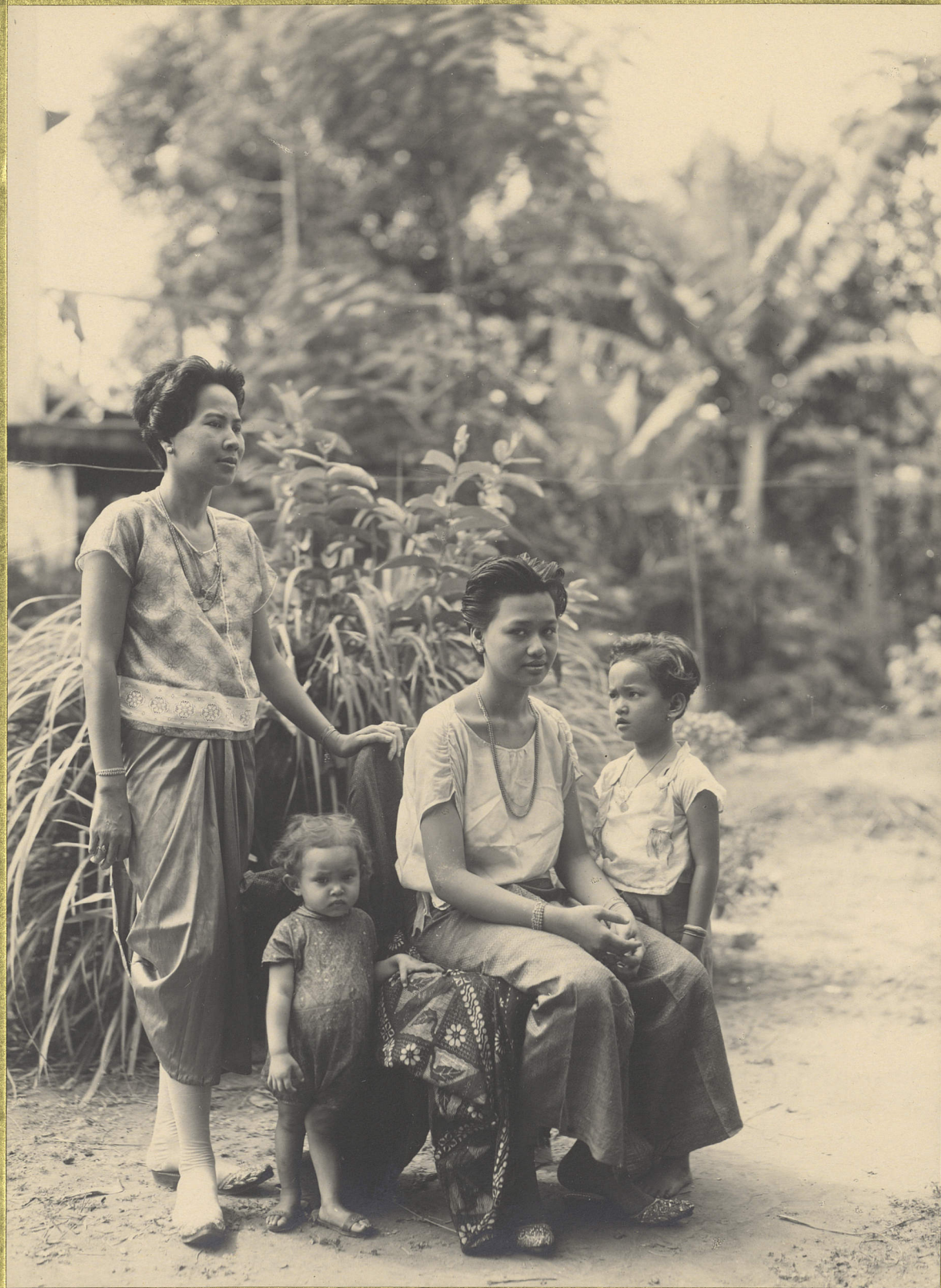
Phnom Penh. Femmes et fillettes

4 CENTRE DE DOCUMENTATION ET DE RECHERCHES SUR L'ASIE DU SUD-EST ET LE MONDE INDONESIEN BIBLIOTHEQUE