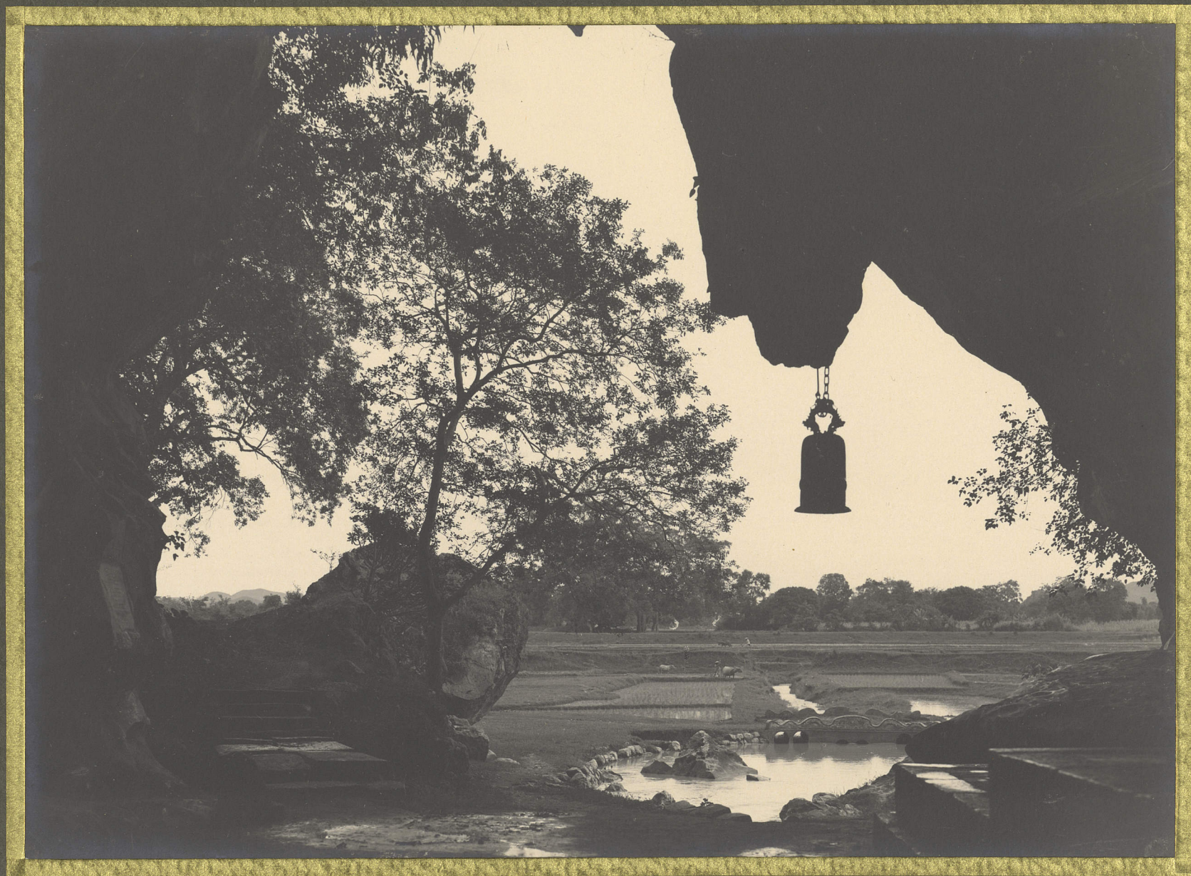
Lang-Son . Grotte de Nhi-Chanh .