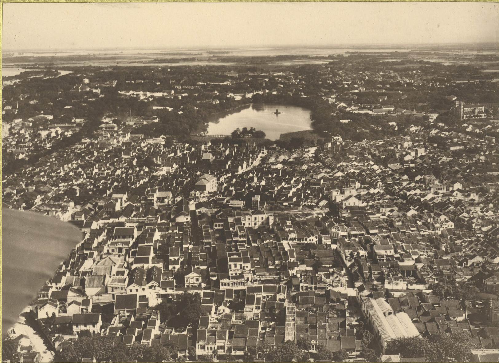
Hanoi. Vue générale.

CENTRE DE DOCUMENTATION ET DE RECHERCHES SUR L'ASIE DU SUD-EST ET LE MONDE INDONESIEN BIBLIOTHÈQUE