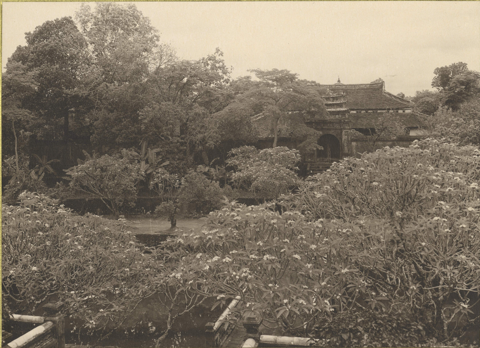
Huế . Tombeau de l'Empereur Minh-Mạng . Les jardins .