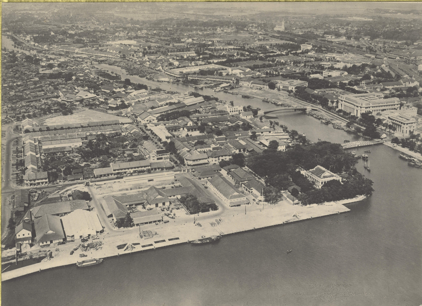
Saigon. Vue générale.