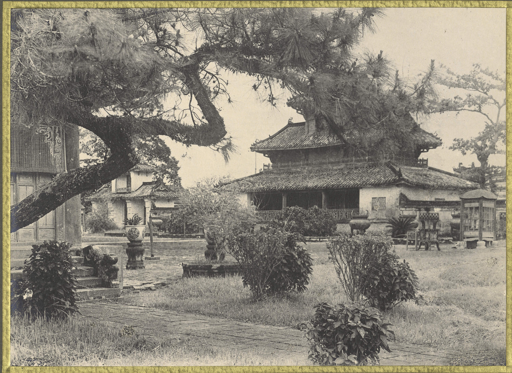
Huế. La cour du temple des urnes dynastiques.

CENTRE DE DOCUMENTATION ET DE RECHERCHES SUR L'ASIE DU SUD-EST ET LE MONDE INDONESIEN BIBLIOTHEQUE