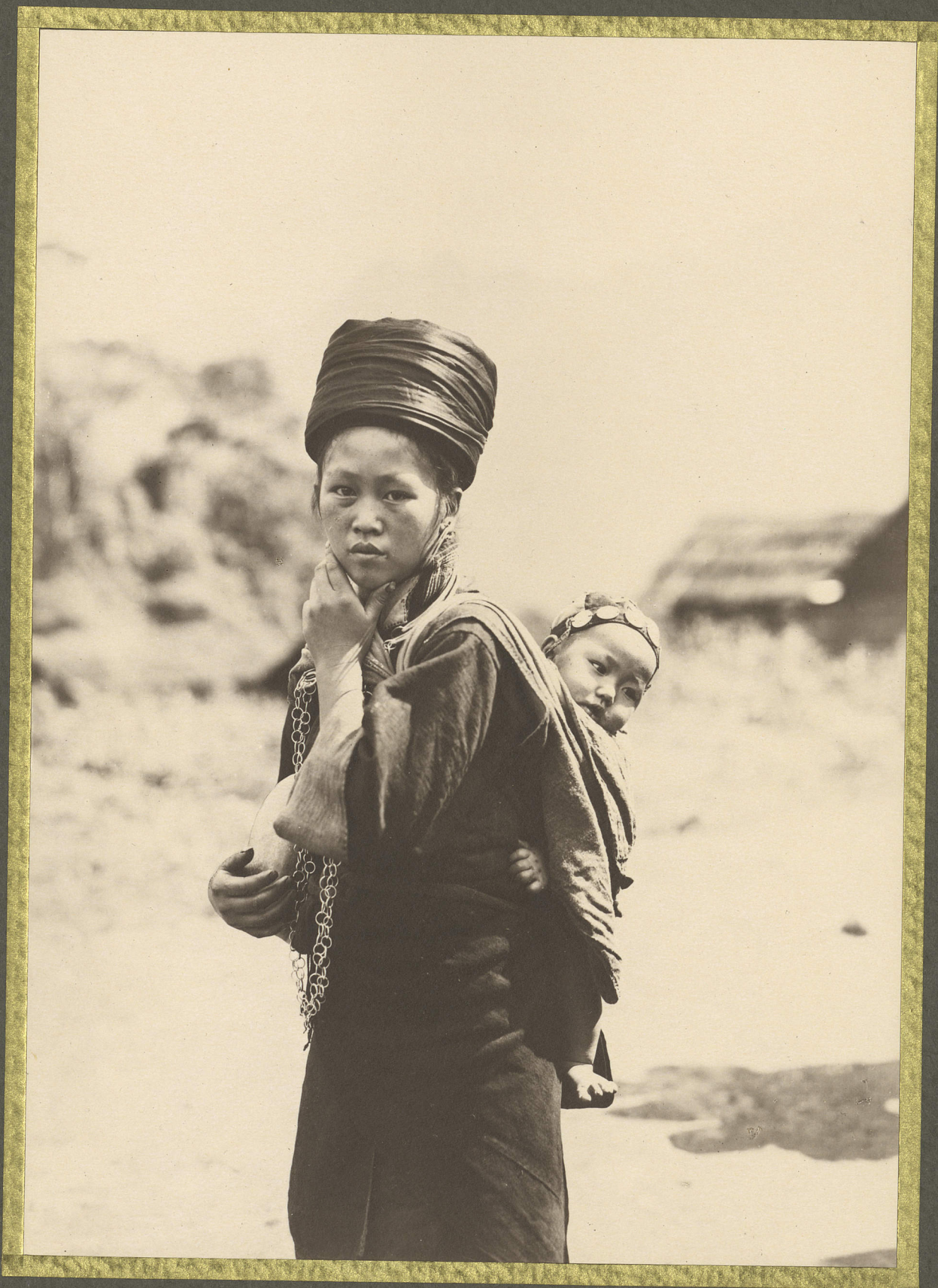
Chapa. Femme Miao et son enfant.

CENTRE DE DOCUMENTATION ET DE RECHERCHES SUR L'ASIE DU SUD-EST ET LE MONDE INDONESIEN BIBLIOTHEQUE