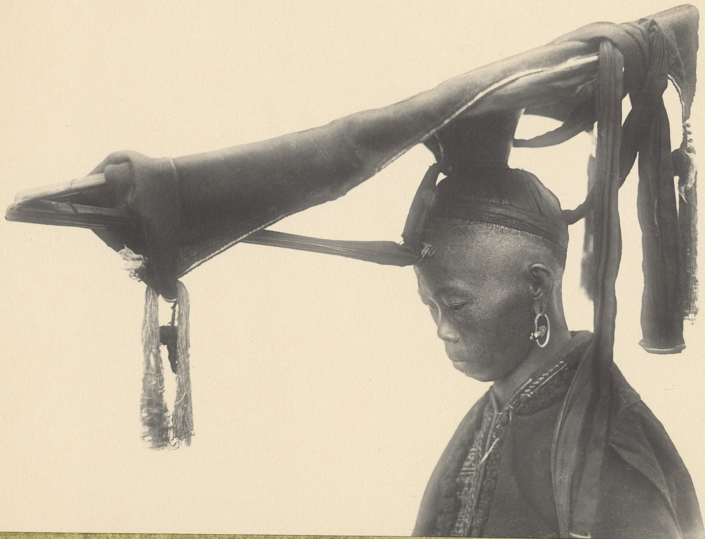
Thong-Sho. Femme Yao-Sin-Dan. Coiffure de mariée.