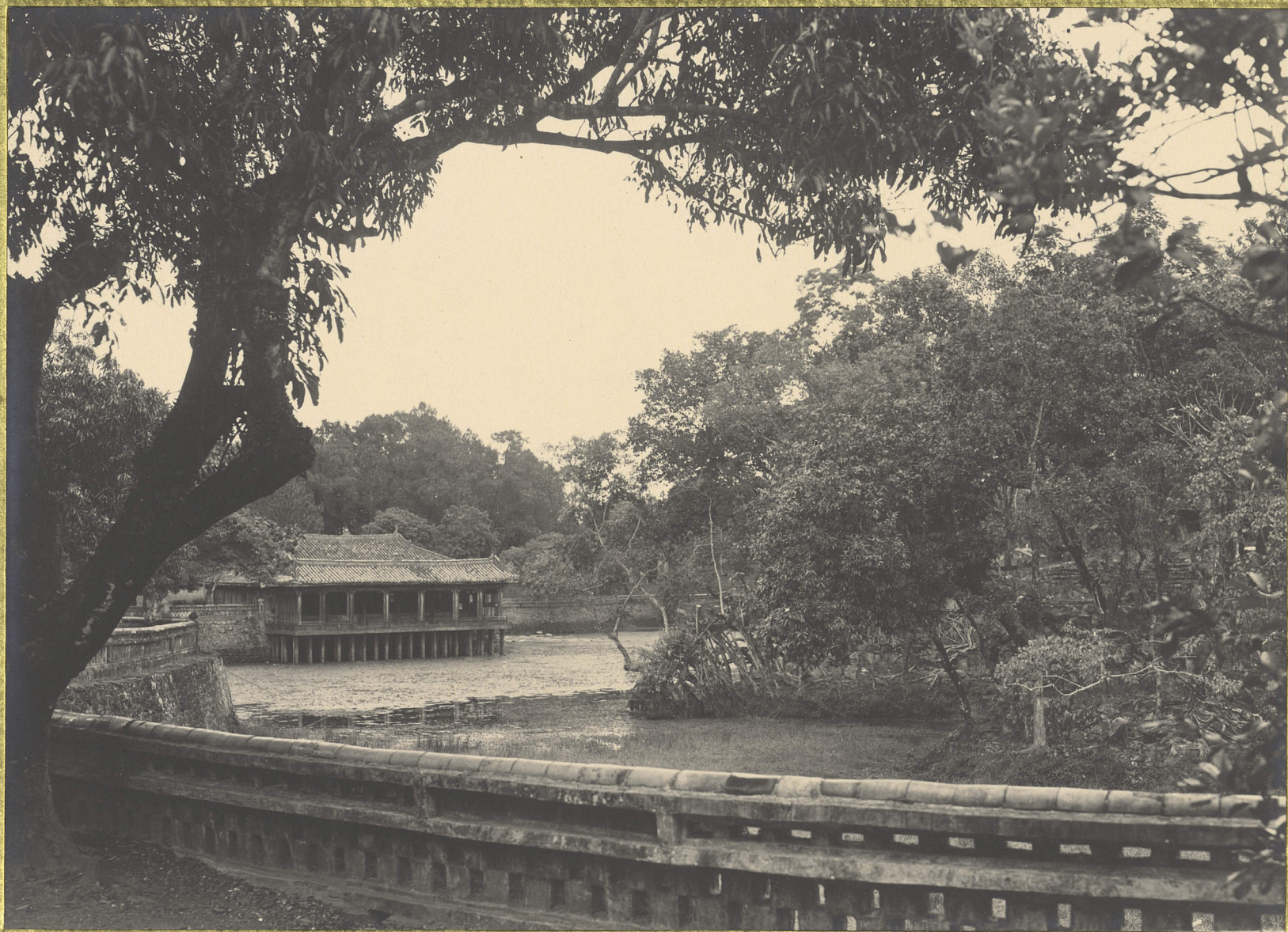
Huế. Tombeau de l'Empereur Minh-Manh. TUDOC Les bains royaux.