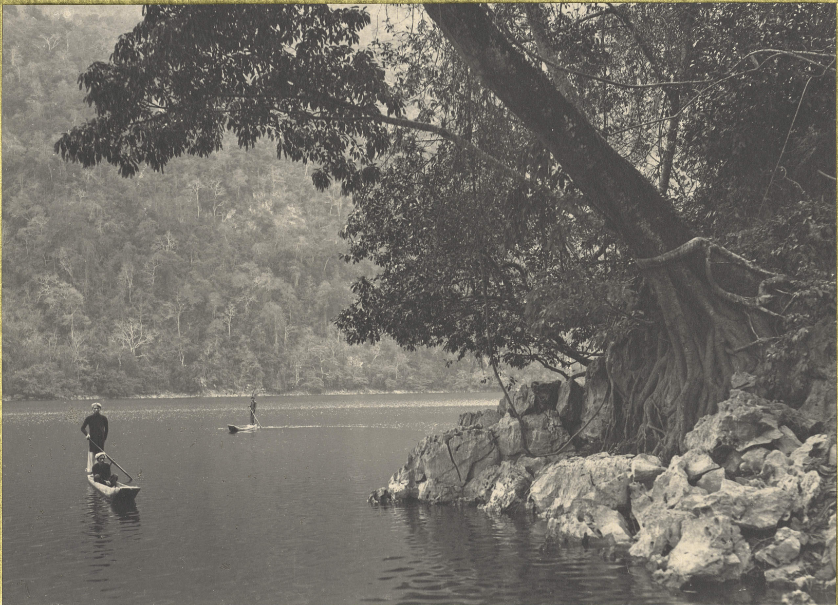
Bae-Kan. Les lacs Bobé.

CENTRE DE DOCUMENTATION ET DE RECHERCHES SUR L'ASIE DU SUD-EST ET LE MONDE INDONÉSIEEN BIBLIOTHÈQUE