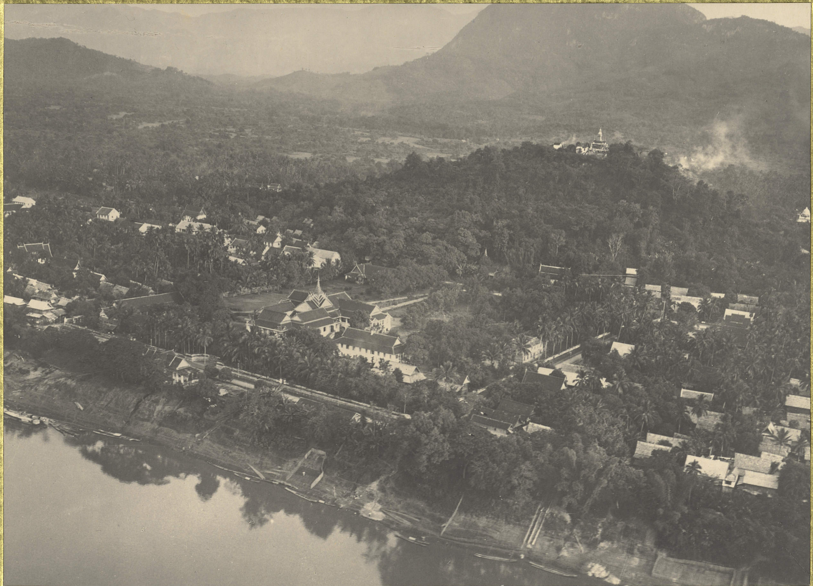
Luang Prabang. Palais Impérial et pagode du Kou-Si.

CENTRE DE DOCUMENTATION ET DE RECHERCHES SUR L'ASE DU SUD-EST ET LE MONDE INDONESIEN BIBLIOTHEQUE