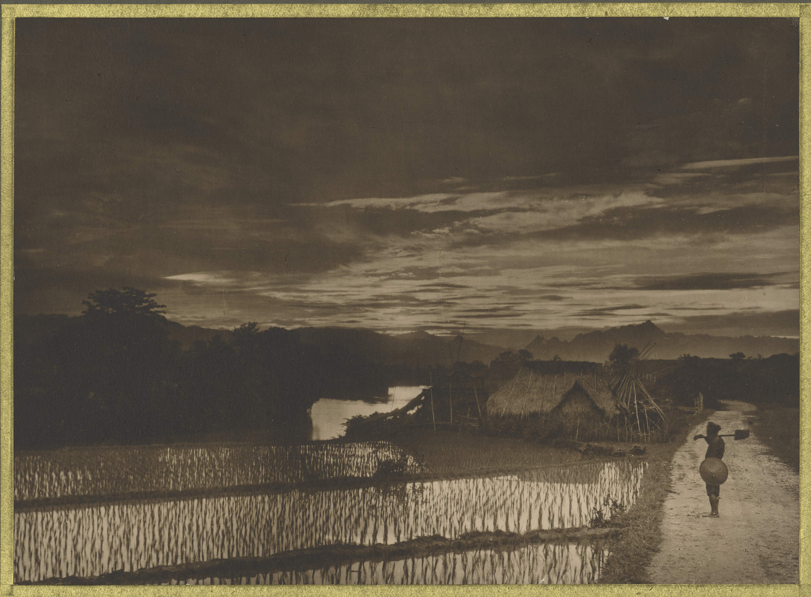
Cao-Binh . Coucher de soleil sur le sông Bôc-Lào .

h. 0 CENTRE DE DOCUMENTATION ET DE RECHERCHES SUR L'ASIE DU SUD-EST ET LE MONDE INDONESIEN BIBLIOTHEQUE