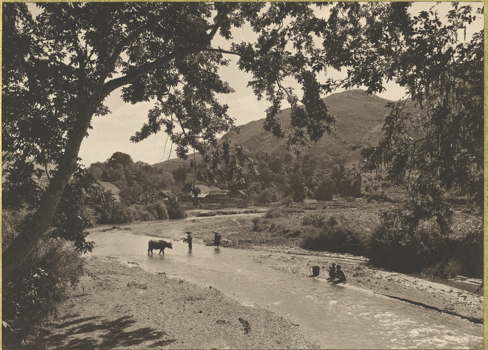
Takha. La rivière.

CENTRE DE DOCUMENTATION ET DE RECHERCHES SUR L'ASIE DU SUD-EST ET LE MONDE INDONESIEN BIBLIOTHÈQUE