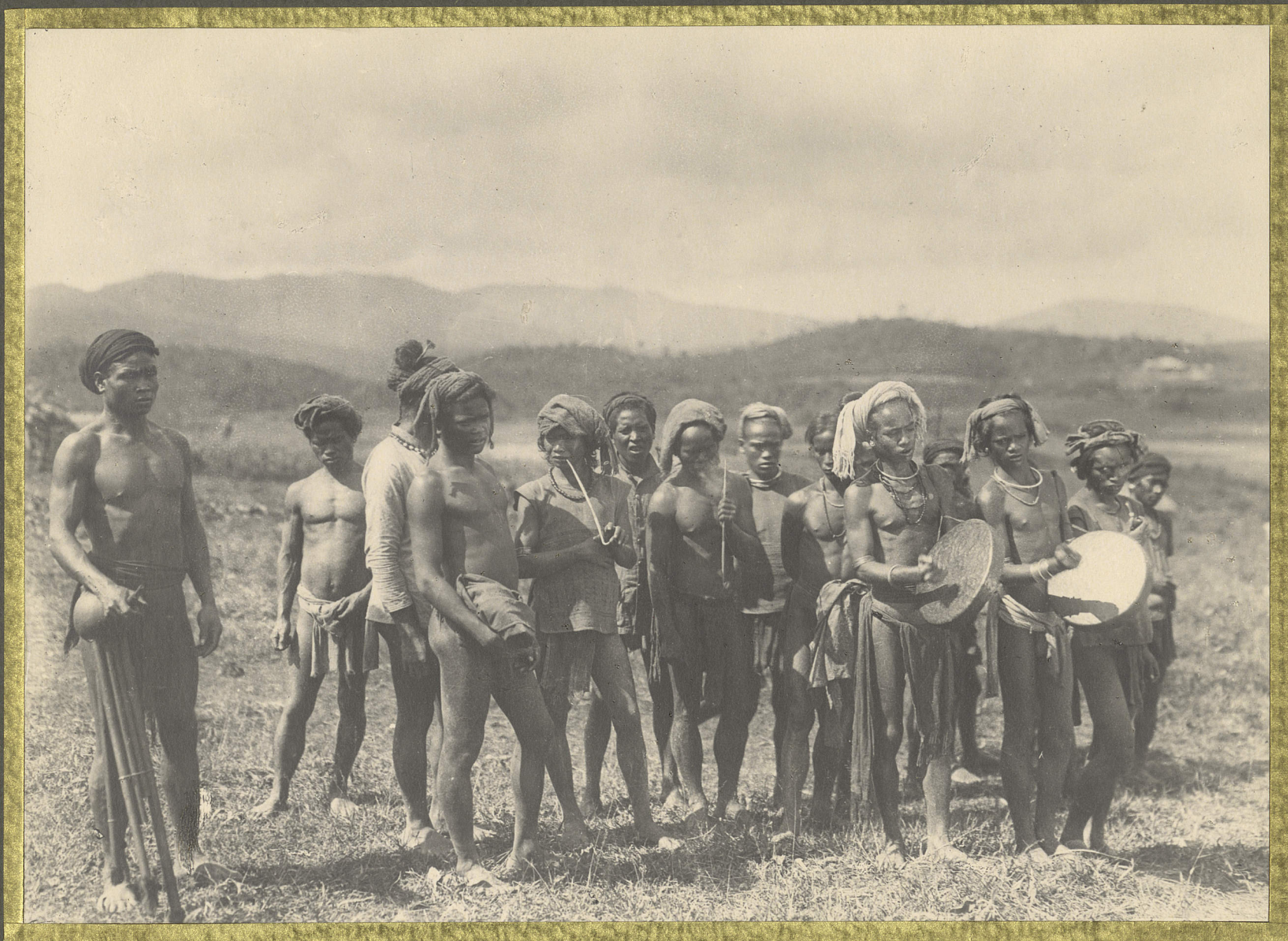
Djiring. Musiciens et danseurs. M'bois