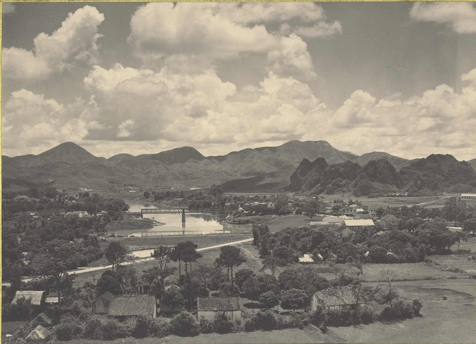
Lang-Son. Vue panoramique.