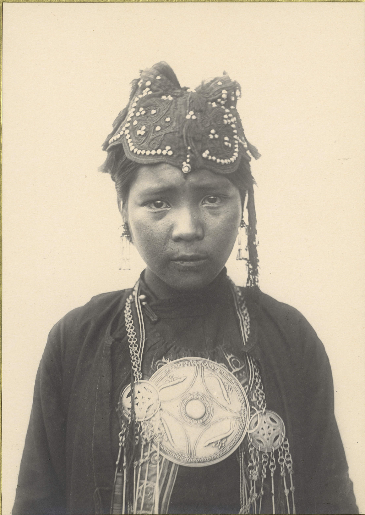
Lao-Hay. Femme Ou-Ni.

CENTRE DE DOCUMENTATION ET DE RECHERCHES SUR L'ASIE DU SUD-EST ET LE MONDE INDONESIEN BIBLIOTHEQUE