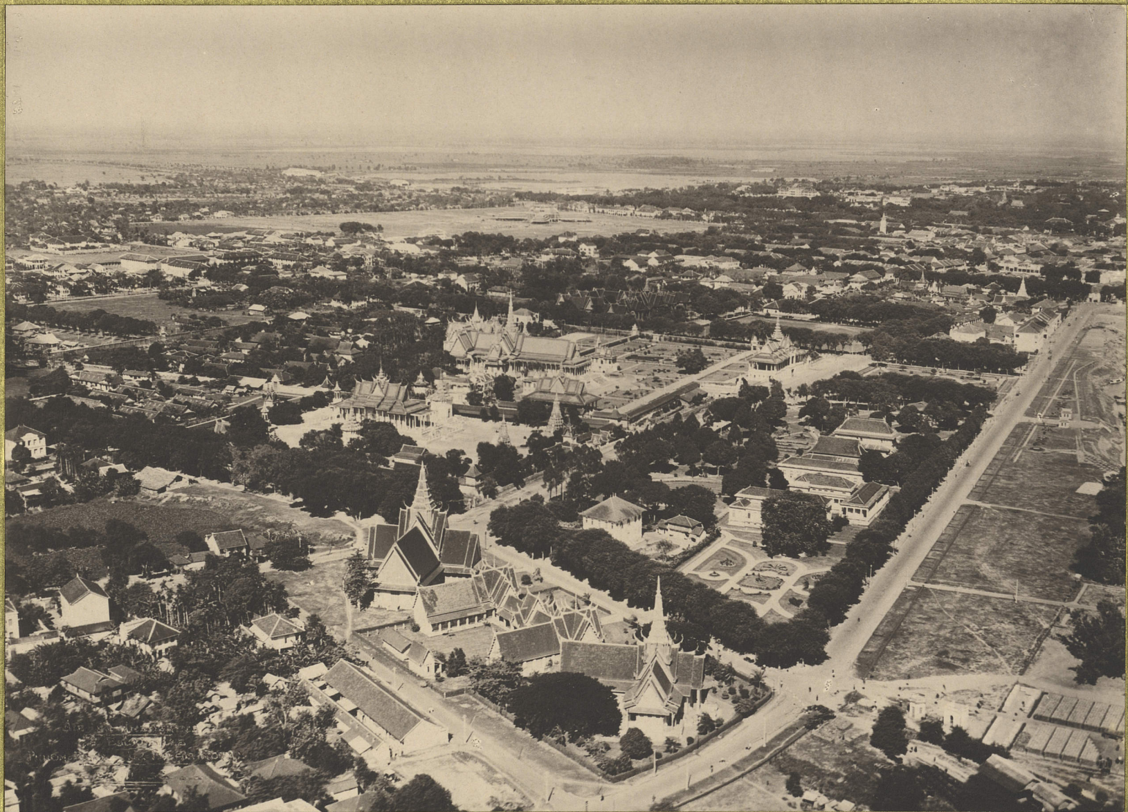
Phnom-Penh. Le Palais Royal.

CENTRE DE DOCUMENTATION ET DE RECHERCHES SUR L'ASIE DU SUD-EST ET LE MONDE INDONESIEN