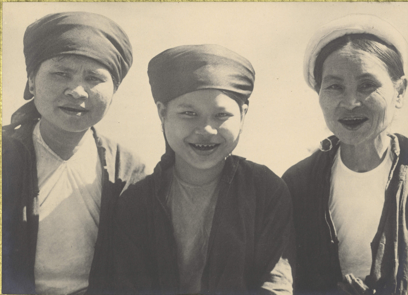
Hladong. Taypames Gonkinoises.