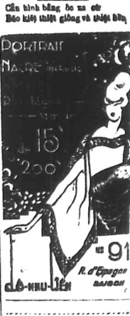
Cần bình bằng ba sự để báo kịp thời thông và tin tức

P. Nguyễn - v. Châu 423, 25 Quai Saigone