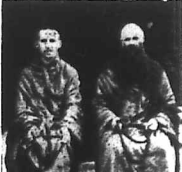
Tại nhà của...