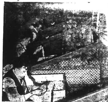
Vừa rồi ở Paris tại sở cảnh sát trong có một cuộc thi lấy 10 người trẻ tuổi để giúp việc trong nhà chớ. Hình trên chụp lúc các học sinh ngồi đua nhau chọn lựa những trứng có bán giảm khảo giao cho.