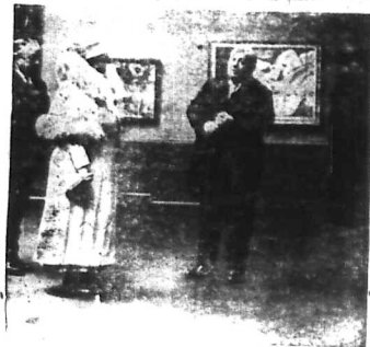
Thủ tướng V. Poincaré và vợ của ông đi cùng vợ ông bay các đồ Mỹ thuật của Pháp tại nhà bảo tàng thành phố Amsterdam. Hoàng hậu ra đi trên các bức tranh đã lấy người Pháp ra ra.