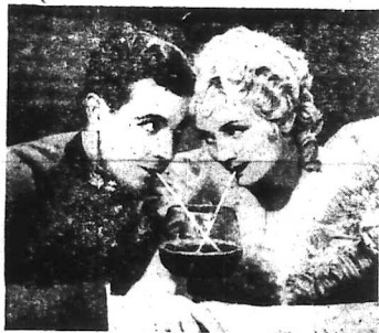
Ramon Navarro và Evelyn Laye trong tuồng "La Chanson de la Jeunesse" (Giọng hát thanh xuân).