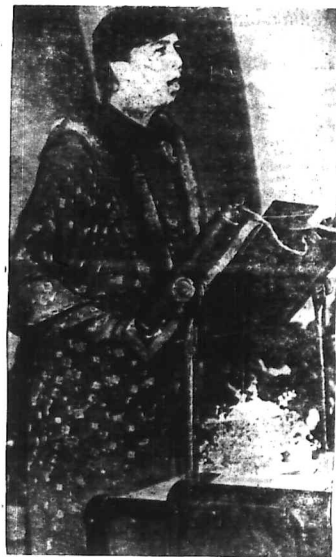
Hon bà xứ người cũng có thể giúp sự bằng giao cho quốc gia và trong là hình bà học với ông thông luật kỳ qua Hollywood David Ben-Gurion mà diễn thuyết được thành giờ nam nữ hoan nghinh lắm.