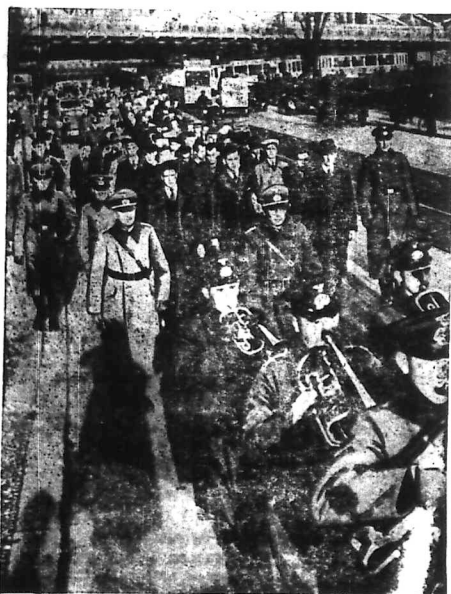
Đây là lính chụp lúc ten Hite bị tách ở Đức khi lập rồi trở về trại. Khi Hitler cầm được quyền chính tay rồi ngài có ra lệnh, dân chúng đến tuổi đều phải đi lính. Vì vậy nên trong đạo binh mới này người ta thấy có nhiều cậu công tử mặt mày sang trọng mà cũng mặc nhung phục mang khí giới thời kèn rất là nhọc nhằn.