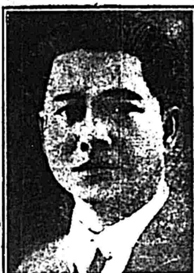
Ông-tinh-Vệ quan Trung ương chấp hành ủy viên. Lãnh tụ tế phải quốc dân đồng chí.