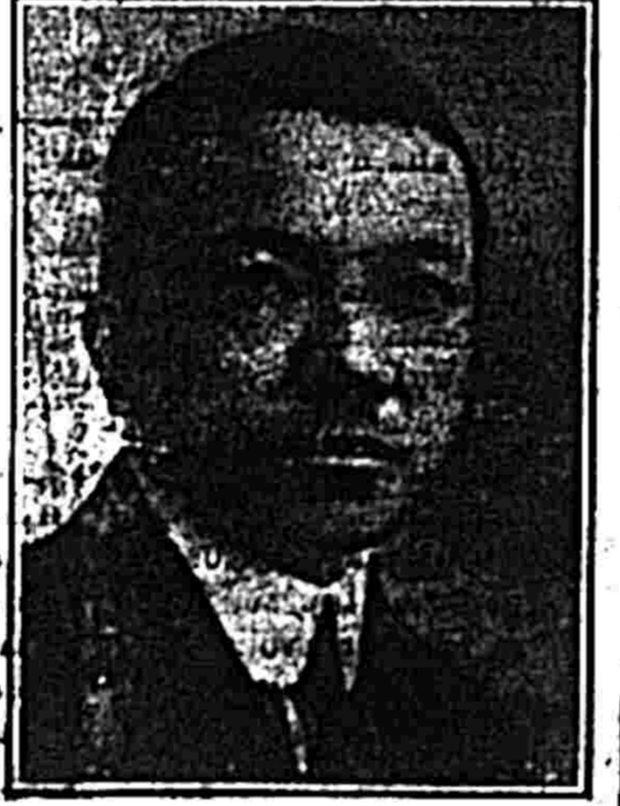
Lý T. Thâm, chủ Quãng-Đông và Quãng-Tây, Lãnh tụ hấu phải bất tỵ phục Quốc dân chánh phủ. Hiện nay bị Tổng tư lệnh Tưởng-giới Thạch cầm tại Đường-tân.