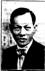
Trần-Huê... (C.F.A.P.)... ngày mai sẽ đăng...