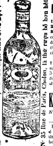
NÊN LƯU Ý

NÊN LƯU Ý Rượu thuốc: 1. Phong thấp 2. Vạn ứng Trật đả 3. Chương-thư của nhà KHUONG-LOI đúng dùng trong những m... thuốc thường phẩm mà bác... cứ ra.