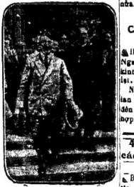
Đảng-quân của đảng Hitler có súng đạn riêng... Liên-linh của đảng Hitler...