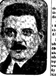
M. Herriot Bộ các Tổng lý... M. Herriot Bộ các Tổng lý, đang nói chuyện về tình hình nông dân.

hàng qua Pháp để bày cho... hàng qua Pháp để bày cho những vị đại biểu.