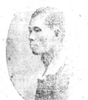
Insurance Co. n° 34 rue L. Gêrard à Saigon hay là bả ông Trưng-Gia Trưng-phước Trưng-công-thần.

Số đường từ 75 tới 79 Tổng đờ Phươc Chông... Ông Hans Im Thomsen... Quận Tàu đem viện binh... Ấy là quân phi-lô