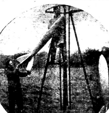
Độc-tơ Nebel nói chuyện bay lên mặt trăng... Liên kháng Hàng-Nga? ... Độc-tơ Nebel nói chuyện bay lên mặt trăng...