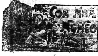
Tác giả: HỒ-BIỂU-CHÁNH