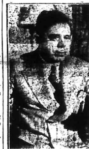
Ông nguyên là nghị-vấn Hoover Long là người đầu tiên ông Roosevelt