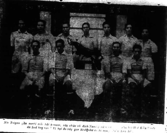
... Hội Etoile du Sud ...