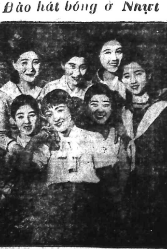
Kỹ nghệ làm phim hát bóng ở Nhat gần đây rất thanh lịch... Kỹ nghệ hát bóng ở Nhat gần đây rất thanh lịch, các nghệ sĩ hát bóng rất đẹp...