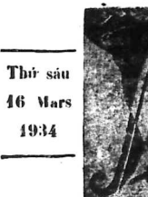
Thư sấu 46 Mars 1934

Ông mất tại ch, đến mùa xuân năm sau, ông cũng bị bệnh tật liên tiếp hàng đ hàng phương ma không hiệu quả, sau đó năm con người này cũng qua đời, ông mất tại ch. Ông mất tại ch, đến mùa xuân năm sau, ông cũng bị bệnh tật liên tiếp hàng đ hàng phương ma không hiệu quả, sau đó năm con người này cũng qua đời, ông mất tại ch.