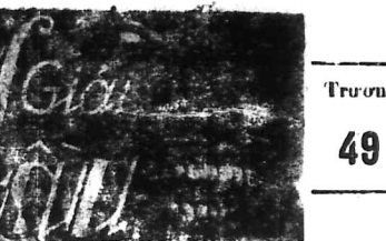
Thư sấu 46 Mars 1934