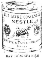
BAY ĐỒNG SỮA BIỂU