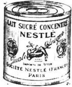
HÃY ĐỒNG SỮA HIỆU