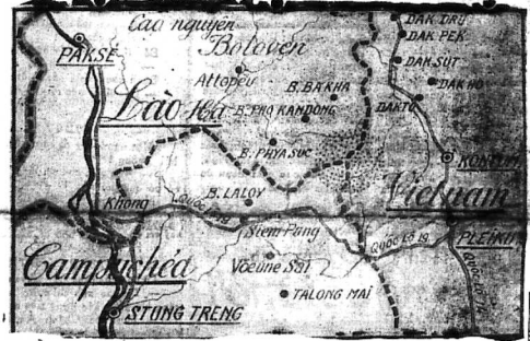
Vị trí hai phi công của Quân lực 7 KONTUM và KLEIKU gần sông và biên giới Việt-Miên. Lộ thương gọi « sông mìn » (lịch công trình sẽ nhiều. Ảnh chụp tại Pleiku. Phía Tây Nam Kontum-Pleiku đi lại qua sông mìn ở (Đài Bắc Kinh).

Xem tiếp D trang 8 Xem tiếp N trang 8 Xem tiếp S trang 8