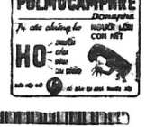
HO... PULMOCAPHRÉ HO...

— Anh có đi hát sao? — Thì tôi sao Lucky và Bà Hai đi đờc mà tôi không đờc đi? — Thì tôi sao Lucky và Bà Hai đi đờc mà tôi không đờc đi? Thơ của Lucky — Anh có đi hát sao? — Thì tôi sao Lucky và Bà Hai đi đờc mà tôi không đờc đi?