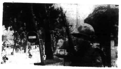
SAIGON - Các đường phố trong lúc chờ Đ. T Minh đi làm lễ nhậm chức Đ. T Minh 25-8.