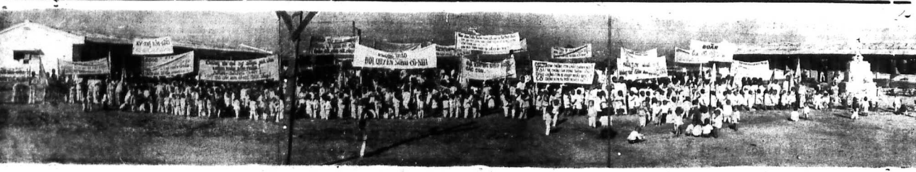
Tại Làng Cổ nhi Long Thành hôm chúa Nhật