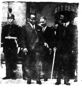
Tổng thống J.B. BOKASSA của Cộng hòa Trung 6 hi vọng do được các bạn tin tưởng bên mặt) cùng ông Tổng Phó Thủ Tướng và Bộ Trưởng (Cộng hòa Côte d'Ivoire) họp chung tại địa phương Thủ Đức (Đình Tổng Thống Pháp) và một buổi họp quan trọng.