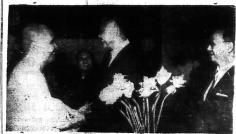
SAIGON - Đại tướng DUƠNG VĂN MINH (thứ hai từ phải) cùng Phó Thủ tướng TRẦN VĂN ĐƠN (thứ ba từ phải) và Phó Thủ tướng NGUYỄN VĂN THIỆU (thứ tư từ phải) tại phòng họp của Bộ Tổng tham mưu ngày 1-11-1970.

Nhân lễ Quốc Khánh Hoạt động của Tổng Th. VNCH SAIGON - Địch Quốc Khánh...