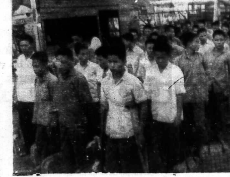
SAIGON 7-7. - Trên đây là 62 tù binh và 24 ngư phủ Bắc Việt đang xuống tầu của HQVN tại Bến Bạch Đằng sáng nay để đưa ra phía Bắc Bến Hải giao trở cho nhà cầm quyền Bắc Việt theo sự thỏa thuận giữa Saigon - Hanoi.

Sau 4 ngày đường biển, tàu sẽ tới ngoài khơi Cửa Tùng (Bến Hải) là nơi hẹn cũ nhà chức trách BV tiếp nhận SAIGON (7-7 Đ.N.N.) - 62 tù binh tầu phở và 24 ngư phủ BV Việt sáng hôm nay được thả trên Tầu vận Trùng. Tổng cục trưởng chấp hành chính trị thay mặt chính phủ VNCH, phóng thích 62 tù binh tầu phở ở Bắc. Lễ phóng thích ở chức tại cầu Thủ Đức, Bến Bạch Đằng Saigon.