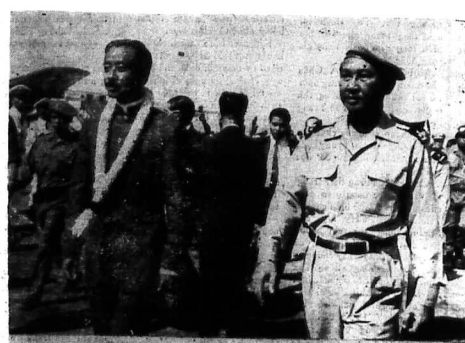
Câu chuyện về một khía cạnh của Việt Kiều Cambi (nay gọi là Kampuchia) nêu lên nhân đạo KC, họ ta bán hơn đôn mùng Phó Tổng Trưởng NG-CAO-KY và phát đơn VINCH đến Nam Vang hôm 4-6-70 như đã ghi trong hình. Riêng hình phía trên là Th. Trương LON (hàng một) đã tiến đến phi công Pochentong (N.V.N) đơn tin Phó T. Th. NG-CAO-KY (hàng hai).

Việt Kiều mong đợi sự giúp đỡ cấp thời của chính phủ VN.CH. và đùm bọc trong nước!