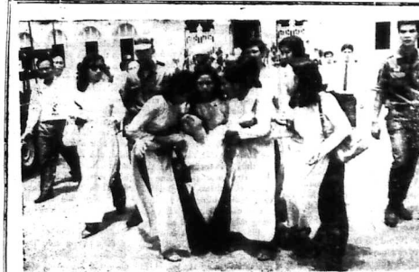
Tại pháp đình sáng 11-5, một số lãnh đạo của GS.D.C. đang ra để giải tán S.H.S chiếm đồng lâu Tiểu An.

SAIGON (12-5). - Trong phần bình luận cuối của bài trình bày về tình hình tại Nam Vang.