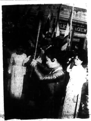
Th. V. Trong khi hành pháp kêu gọi dân chúng đóng góp và sống khác khổ thì...

Thư này bắt buộc chỉ gửi VC sau, chính phủ Cam Bốt ngưng thi hành các bước hướng tới ký với VC