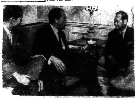
TỔNG THỐNG NIXON TIẾP NGÀI TRƯỞNG TRẦN VĂN LÂM TẠI NƠU ƯỚC NGÀY 18-9-69

trước khi có l giải pháp cho chiến cuộc * VẤN THEO TỔNG-THỐNG VCH. - CS. sẽ tấn công lớn vào đầu năm 1970 - Nếu HK rút hết binh sĩ khỏi V.N thì miền Nam vẫn tiếp tục chiến đấu