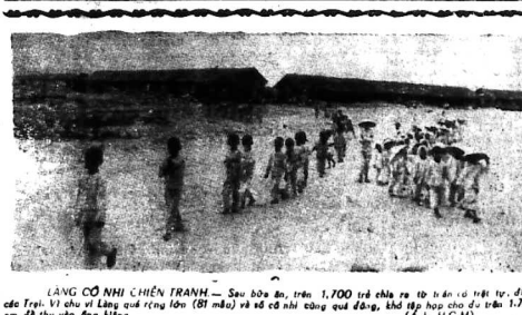
LÀNG CỎ NHÌ CHIẾN TRANH - Sau bốn n, trên 1.700 tể nhà...