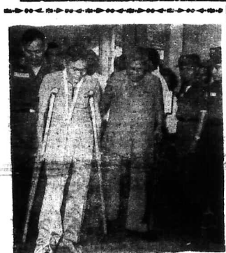
Một cụ già, tay chống gậy, tay đưa một thanh niên bị thương đi từ trước ngõ đình làng...