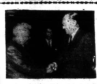
1M.T. Ông T. Th. NIXON nói rằng, Ngoại trưởng Mỹ ROGERS tại Phi Tân Lương hồi 16 giờ 30 phút ngày 15-5-1968.

Trận tấn công bằng trực thăng vận lớn nhất