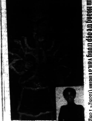
Và bên dưới đây, con trai... Kim Hoàng tử đẹp trong vai Hoàng Đế...