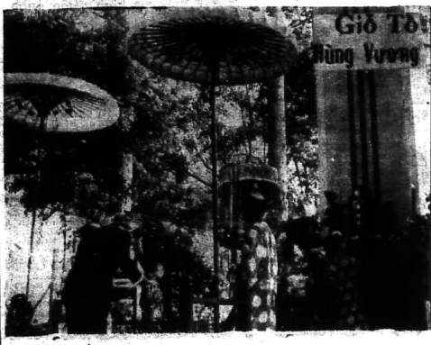
Giới Tô Hùng Vương

HOA ĐÀM Lập trường dị biệt của Đồng minh và C. S. C. S. KHÔNG CHỊU THẢO LUẬN vấn đề Cambốt và Lào