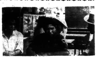
HÌNH TRÊN: Hai hàng ghế trong vụ mưu sát Thủ tướng Trần Hưng Đạo (Đang trong Cam-tu) - một ảnh chụp Biệt Động Quân Việt Nam. (Đang trong Cam-tu) - một ảnh chụp Biệt Động Quân Việt Nam.

Tuần báo Mỹ tiết lộ: HƠN 3 SU-ĐOÀN CỘNG-QUÂN AN TẠI CAM-BÔT Đường mòn Hồ chí Minh ở độ dài bằng... xe lửa