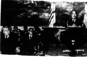
Hôm 18g chiều 6-2-69 TT Ng. văn Thiệu đã mở cuộc họp báo quan trọng tại Phòng Khá h. Tổng Thống Độc Lập với sự tham dự của hàng trăm ký giả trong và ngoài nước VN và ngoài quốc gia.

Đang có các cuộc mật đàm giữa MV-VNCH và Bắc-Việt ở Pháp? MỘT SỰ «ĐẦU HÀNG» của Mỹ và Việt-Nam C.H. tại Balé!