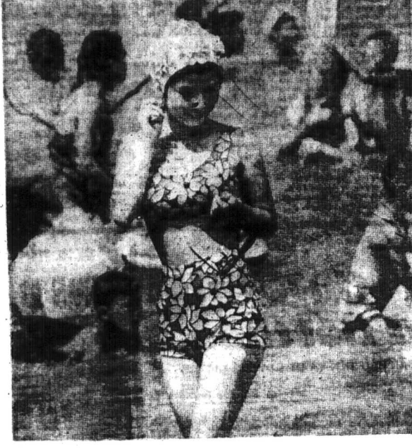
Dân chúng Đại Hạp vui mừng kỷ niệm 21 năm GIẢI PHÓNG và ĐỘC LẬP năm thứ 19. Một hình ảnh hòa bình vinh quang mà dân chúng Việt Nam đang mơ mộng...

Năm thứ 4 • Số 123 • Từ 27-8 đến 2-9-66 • 8 Trang 5d