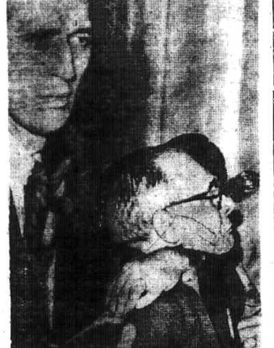
KHI NGƯỜI TRÍ THỨC ĐƯỢC... «STOP!»