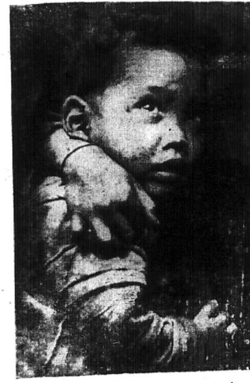
Một cái tin rất nhỏ trong tuần đọc «BÌNH-MINH HỌC ĐƯỜNG» trang 6