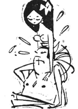
Tranh sống đời này thì quá... ắc ôn!

Giới chạy xe cho Mèo tui kiểm án được, nhưng ngày nay thì có hơi đông nên cuộc « tranh đua » có nhiều gay cấn, vất vả hơn. máy thay Cánh sắt chặn lại, đôi Mèo xuống xe, lấy giấy tờ người lái, có người bị bắt là khác. Mặc dầu chưa có vào thư, hay công văn nào chánh thức « xét, bắt » các người chạy đua tranh sống chữ Mèo. Cá. — Thế là... nghèo mặc thêm một cái eo! Hí hí! Đời vui thế.