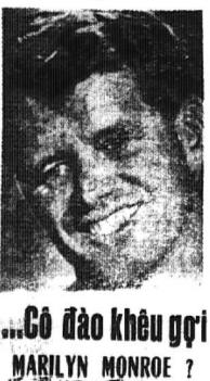
MARILYN MONROE đã tự tử...