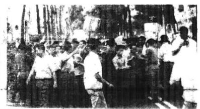
Người từ Cà Mau, người từ Quảng Ngãi... tập nhen lên T.T.H.L. Quang Trung, họ sang 2 tiếng lễ khai kinh.