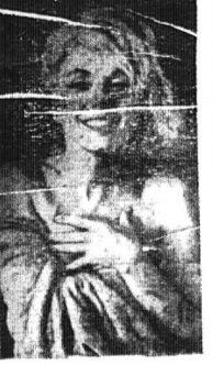
MARILYN MONROE đã tự tử...