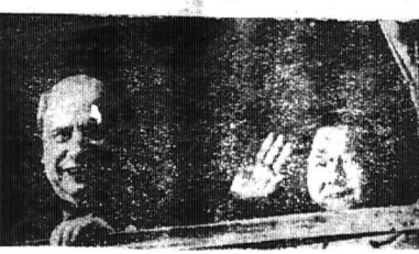
KROUTCHEV làm cảnh sự NINA