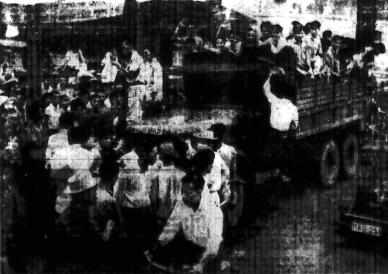
Trong năm nay sẽ có 11 hàng tuổi thi hành quân dịch