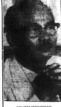
SOUPHANOUVONG tính tại Pathet Lào

Tin chính thức cho hay rằng cuộc hội họp của phe Ai Lao tại La Celle-Saint-Cloud dự liệu vào hôm 29.9.61 tại... Trường phái đoàn hiện tại, đại sứ Noupbat Chounnamay, tuyên bố không biết lý do bất ngờ.