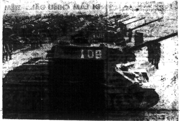
„Ngươi Mông trong giai đoạn bang giao căng thẳng với Nga Sô“ (Xem bài Bình Luận Thời Cuộc)