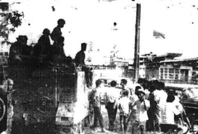
BỘ T.T.M.: Bên trong súng chĩa ra bên ngoài sẽ thấy giúp hướng họng súng của, ở giữa... dân chúng đi xem.