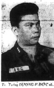
T. Tướng DƯƠNG-V.ĐỨC.