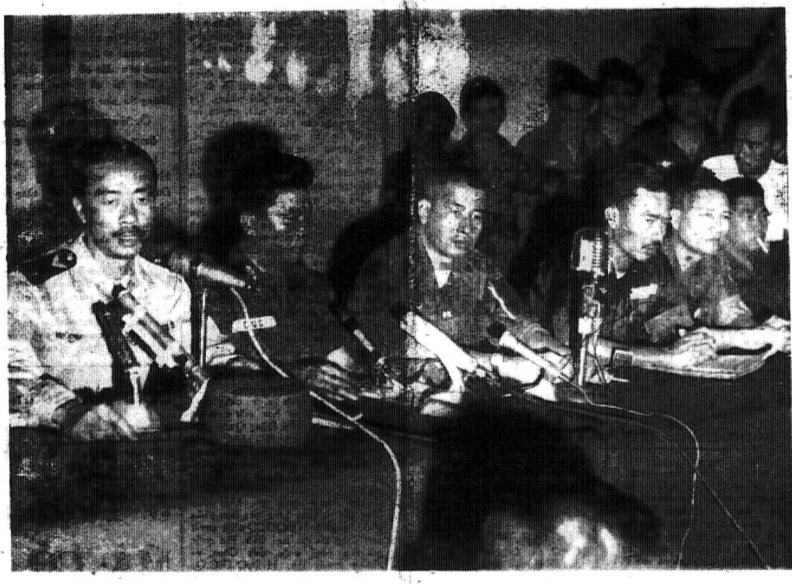
Màn chót ly kỳ của cuộc Chánh biến 13-9-64 cho thấy sự hợp sức kết nối giữa các tướng lãnh gọi là «đảo chánh» — T.T. Dương Văn Đức (ngồi giữa) Chuẩn tướng Nguyễn Cao Kỳ, Tư Lệnh Không quân — Từ trái sang phải — cố Chuẩn tướng Cao Văn Viên, Tư Lệnh Q.Đ. Nhảy Dù. Bên cạnh C.T. Cao Văn Viên có Chuẩn tướng Nguyễn Chánh Thi) hiện diện các Tướng lãnh gọi là «đẹp đảo chánh» là cựu Tổng Kỵ, Viên, Thủ.