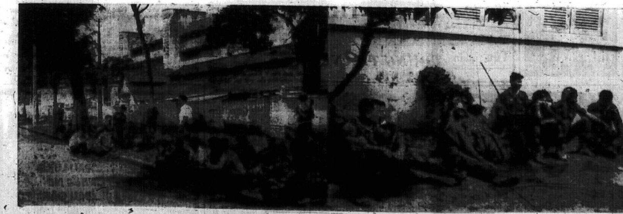
Thầy ở các trường chuẩn bị «đào tạo» nhân viên chính phủ, anh em chiến sĩ các đơn vị tiến về thành Đ. Trưng tướng này có thể có Thủ Tướng Lâm và Thủ Tướng Dương Văn Đức... Trưng tướng này có thể có Thủ Tướng Lâm và Thủ Tướng Dương Văn Đức...