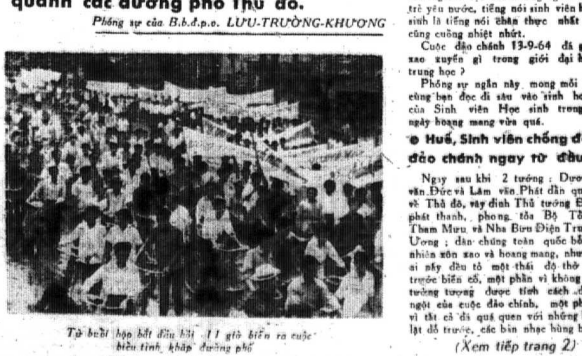
Tập hội họp Mặt Dân Hội 11 giờ đêm ra cuộc biểu tình, khắp đường phố (Xem tiếp trang 2)

* HUY: T.H.S.V. cực lực chống đảo chánh. * SAIGON : H.Đ.C.Đ.S.V. đã phá cuộc đảo chánh làm rối loạn hàng ngũ Quốc gia. — THSV: Trưng tướng KHÁNH — phải công bố minh bạch hồ sơ 5 Tướng lãnh trước nghị giao hoàn Bộ Quốc Phòng. — BIỂU TÌNH bất bạo động của H.S.V quanh các đường phố Thủ Đ.