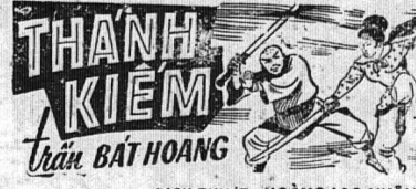
DỊCH THUẬT: HOÀNG-LẠC-NHÂN